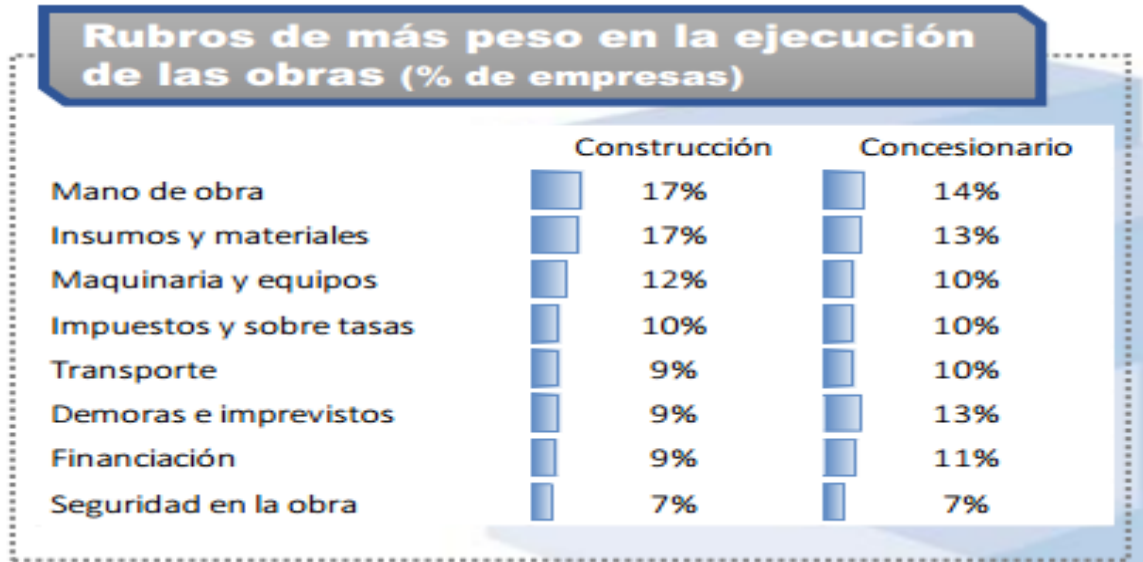
Tabla N° 3. Rubros de más peso en la ejecución de las obras.

Tomado de la Dirección de asuntos económicos. Cámara colombiana de la infraestructura. Dic 2014