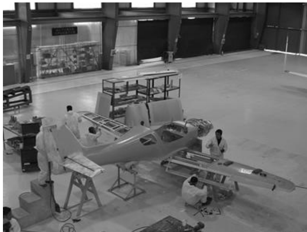
FIGURA 1: AVIÓN DE ENTRENAMIENTO T-90

Esta figura muestra la elaboración de nuestro primer avión realizado por la CIAC corporación de la industria aeronáutica colombiana el T-90, acompañados por personal de ingenieros aeronáuticos e ingenieros mecánicos de la FAC, el cual permitirá a nuestros alumnos de la Escuela Militar de Aviación (EMAVI), disfrutar de su adaptación al vuelo y recibir el entrenamiento básico primario para la conformación de nuevos pilotos en la Fuerza Aérea Colombiana.