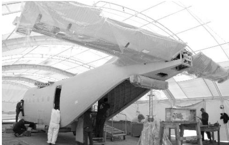
FIGURA 2: MANTENIMIENTO AVIÓN CASSA 212

En esta figura nos muestra como se realiza un overhaul completo a una de nuestra aeronaves como lo es el casa 212 de fabricación española en uno de los hangares de la CIAC, en donde una a una es inspeccionada cada una de sus partes con el fin de hacer reparaciones o cambios no solo a la estructura física del avión si no a todo el tema de aeronavegabilidad, electrónica, y comunicaciones.