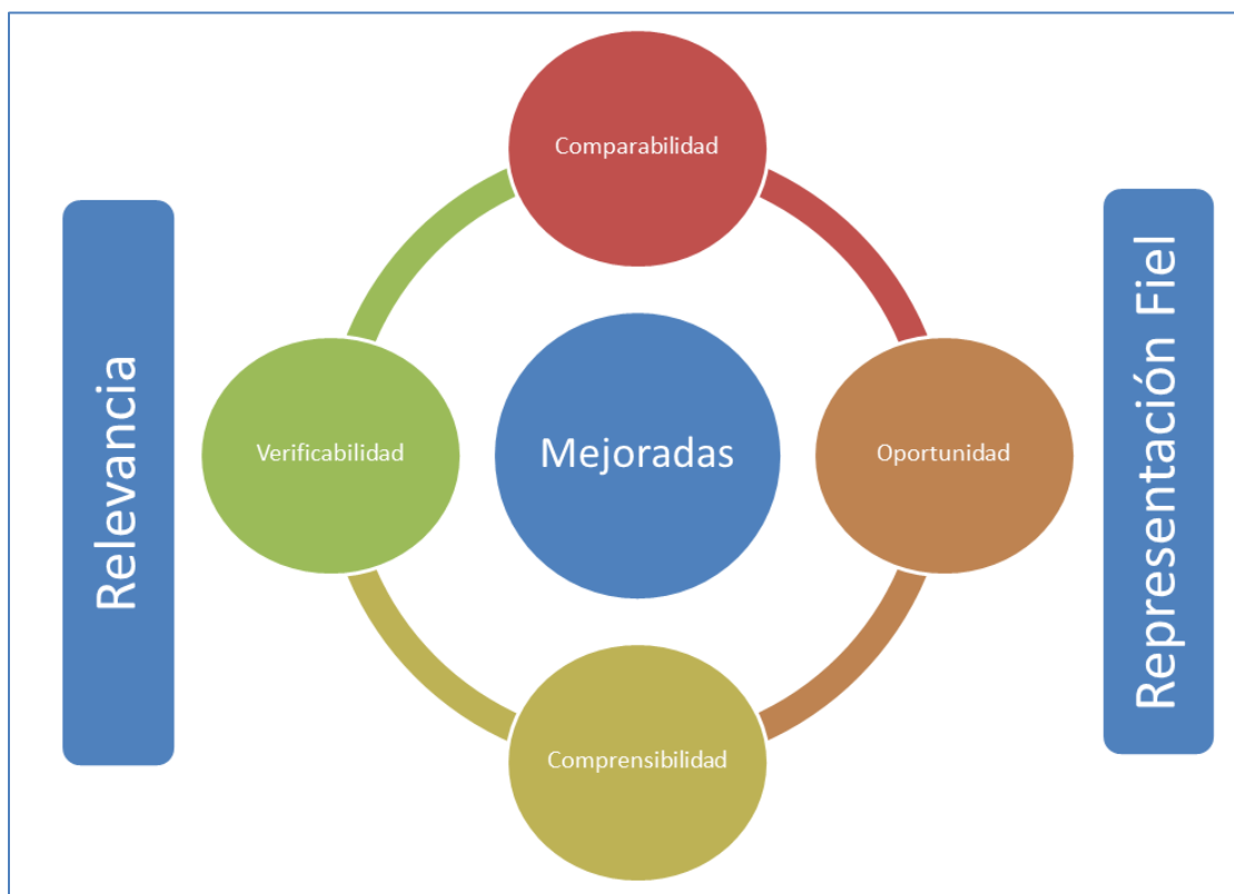
Gráfico No. 1 Características cualitativas del IASB

De manera específica las características cualitativas que determina el IASB las estructura en fundamentales y en mejoradas dentro de un todo, como lo muestra el siguiente gráfico.