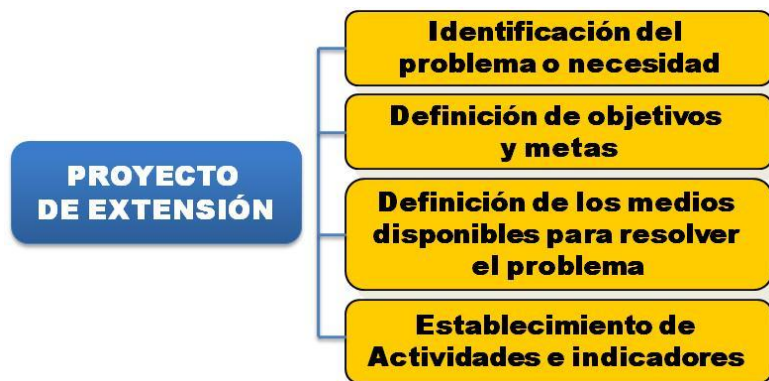
Figura No. 2 – Etapa de Formulación e identificación

Finalmente y teniendo en cuenta la importancia de esta etapa en el éxito o fracaso de un proyecto, el proceso planeación de una iniciativa de extensión debe obedecer a un esquema estructurado que evalúe en primera instancia la factibilidad y pertinencia del mismo en el mejoramiento de la calidad de vida de los ciudadanos al igual que debe establecer las bases para realizar el seguimiento en la consecución de los objetivos propuestos.