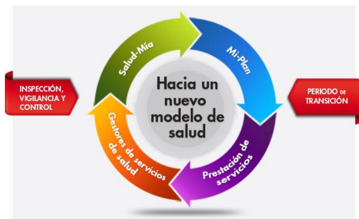
Grafica 2