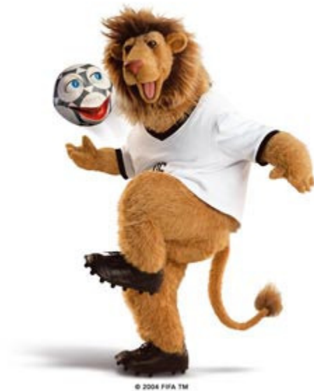
Ilustración 5: Goleo IV y Pille, mascotas oficiales Mundial Alemania 2006

entrando a espacios alternativos como programas televisivos o entrando en la población infantil (movilizando adultos alrededor), entre otras posibilidades. Particularmente las mascotas son ampliamente utilizadas en los espacios de competición deportiva de equipos, por ejemplo en las Copas Mundiales de Fútbol con estas representaciones generalmente se pretende presentar las características del país anfitrión y los patrocinadores locales.