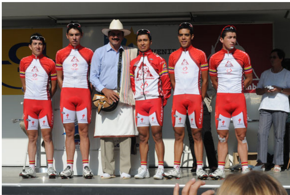
Ilustración 4: Juan Valdez y el equipo de montaña del Tour L'avenir (Café de Colombia)

Ahora ligados con la campaña Colombia es Pasión y con sus patrocinados, la imagen de Juan Valdez y los productos e ideologías que representa son una de las estrategias de posicionamiento de marca más relevantes de Café de Colombia en el mundo entero.