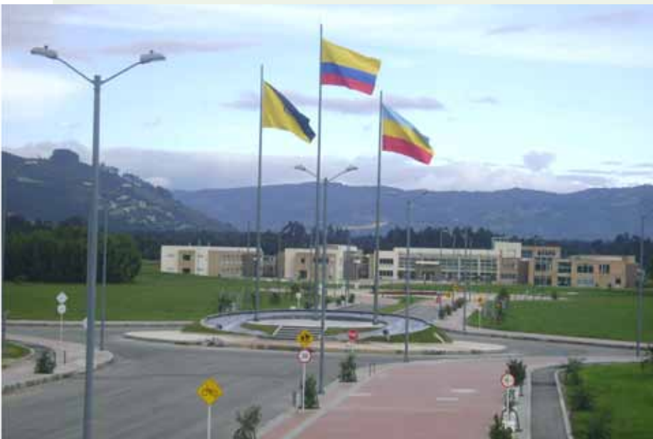
Plazoleta de Banderas Campus Nueva Granada