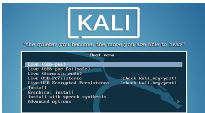
Figura 3 – Opciones de arranque de Kali Linux 2016.1

Bajo ese mismo sentido, esta distribución posee una caja de herramientas relativamente pequeña para realizar análisis forense de evidencias digitales. Incluso, puede ser utilizada para un Análisis en Caliente, debido a que tiene una opción de arranque en "Modo Forense", tal y como vemos en la Figura 3. Este modo permite iniciar el equipo comprometido sin montar automáticamente las unidades de almacenamiento internas y externas que puedan modificar en alguna medida la información contenida en ellos.