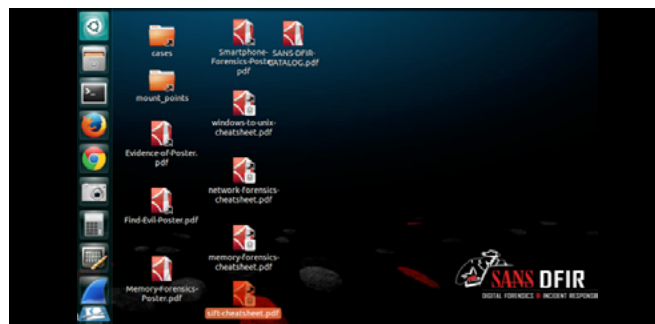
Figura 5 – Entorno de trabajo de SIFT

SIFT (SANS Investigative Forensic Toolkit) [10]: basado en Ubuntu, es una plataforma que ofrece al investigador una serie de herramientas para realizar una investigación detallada de la evidencia digital. Soporta los diferentes sistemas de archivos de los sistemas operativos actuales, además de contener aplicaciones que ayudan a crear imágenes íntegras de los dispositivos de almacenamiento, recuperación de archivos, documentos e imágenes, herramientas para examinar logs de diferentes dispositivos, entre otros. Una de las ventajas de SIFT es que a partir de cualquier distribución de Linux puede generarse este set de herramientas forense haciendo la instalación de los paquetes necesarios para el mismo. Además, cuenta con una gran cantidad de manuales y guías que ayudarán a los que se encuentran comenzando en el ámbito de la Informática Forense para que sepan utilizar las distintas herramientas, tal como se ve en la Figura 5.