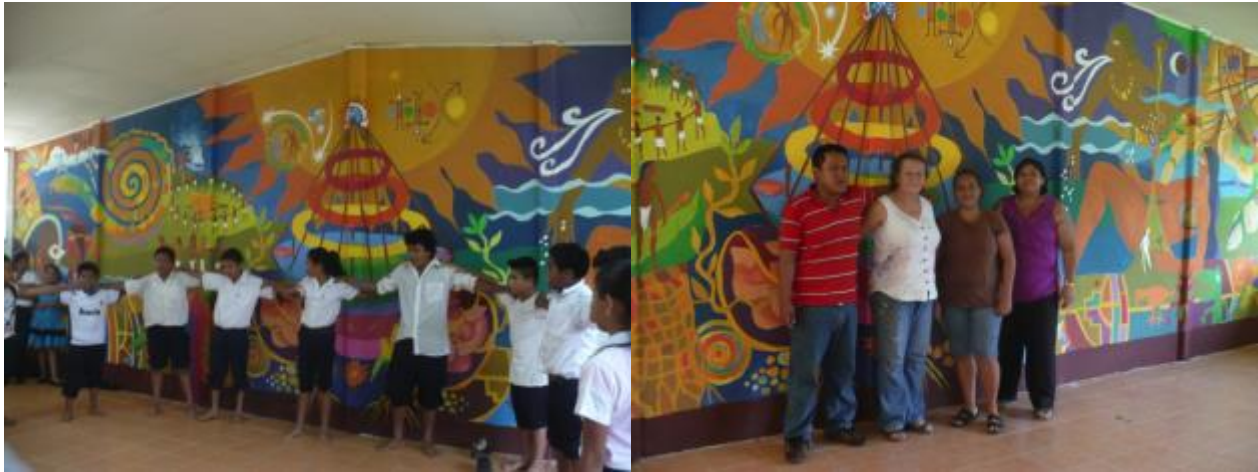
Imagen 11 y 12: Mural de Bambú