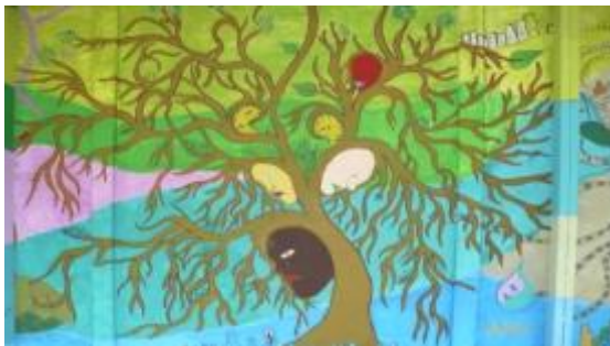
Imagen 9. Mural Chomes

Se cree que las islas del Golfo de Nicoya jugaron un papel muy importante en el intercambio cultural de los indígenas de Nicoya con las otras culturas de Mesoamérica, como los Mayas. También hace suponer que existía una diversidad étnica y lingüística. En los distintos murales vemos homenajes a la mujer pianguera, también se pintan las principales actividades comerciales de las islas y los pueblos costeros, como la pesca artesanal, también podemos encontrar agricultores.