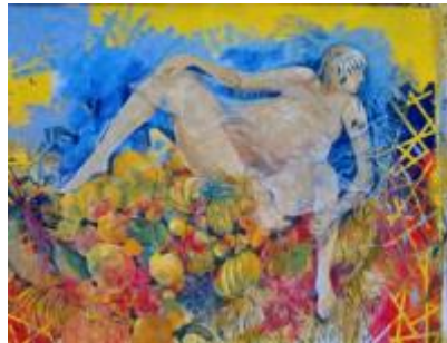
Imagen 2. Mural “La madre naturaleza” pintó Marianela Salgado. Pared exterior del estadio de Orotina. Fue borrado por el sol y los agentes naturales.