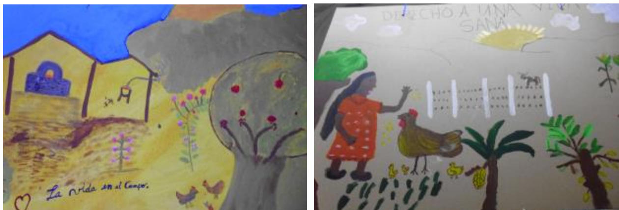
Imagen 16: Dibujos realizados por las mujeres en los talleres.

Como parte de las actividades de este proyecto tenemos a las mujeres reconociendo y apropiándose de la pintura como una forma de expresión y de identidad de su condición de mujeres del campo y la relación con su entorno. Participan en la concepción de elementos gráficos para la composición colectiva de murales. (Ver imagen 16). Las mujeres adquieren destrezas y conocimientos en pintura y dibujo para la expresión.