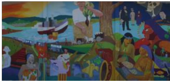
Imagen 10. Esparza