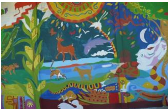
Imagen 7. Mural Isla de Chira

Las localidades que abarcó este proyecto son Isla de Chira, Isla de Venado (ver imágenes 7 y 8), Isla Caballo, extendiéndose a Costa de Pájaros, Chómes, Esparza (ver imágenes 9 y 10) Manzanillo, Punta Morales, Orocú.