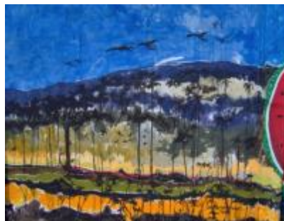
Imagen 5. Mural “Orotina en sus inicio” pintó Erick Vargas. Pared exterior del estadio.