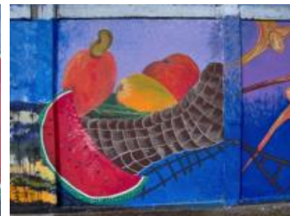
Imagen 6. Mural “Frutas” pintado por artistas costarricenses. Pared exterior del estadio.