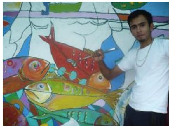
Imagen 8. Mural Isla de Venado