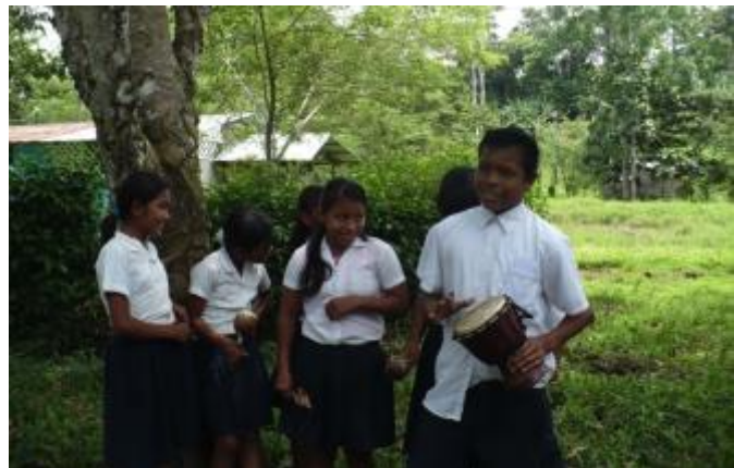
Imagen 14: Talleres con instrumentos

Igualmente se realizaron cinco murales en el marco del Proyecto “Salud Ambiental en las comunidades del Golfo de Nicoya”, utilizando la misma metodología de talleres con las comunidades y reflejando en las obras la identidad cultural de los pueblos, su flora y su fauna, los sueños de los jóvenes. Se realizaron murales en la Isla de Chira, en la Isla Venado, en el Colegio de Chomes, en el Colegio de Costa de Pájaros y en la Escuela de Orocú.