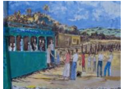
Imagen 3. Mural “La Estación” pintó Roberto Zúñiga. Pared exterior del estadio.