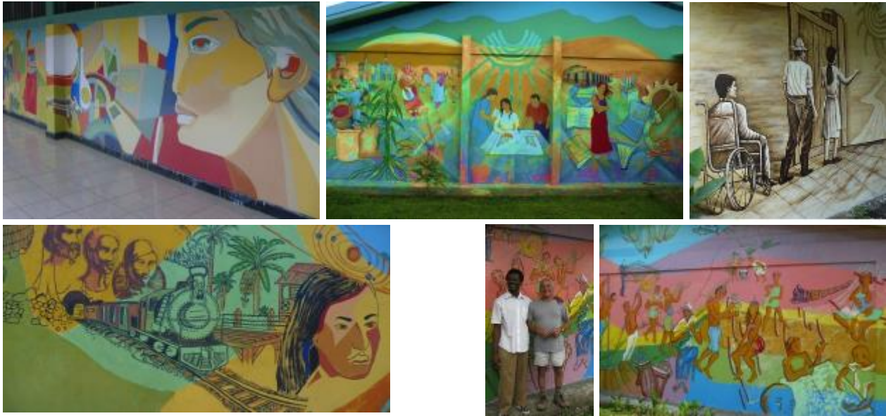
Imagen 7. Murales en los Centros Universitarios de la UNED para el proyecto 7 Murales para 7 Provincias. San José, Heredia, Palmares, Turrialba, Limón.

talleres de valores y sobre la paz. Los niños aportan su visión sobre los derechos, y los pintan, luego se pintan murales con sus diseños.