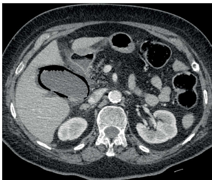
Figura 1: Tomografia Computorizada (TC) – corte axial com contraste endovenoso em fase portal, identifica-se vesícula biliar distendida, com densidade aérea envolvendo todo o seu contorno parietal, compatível com colecistite enfisematosa.