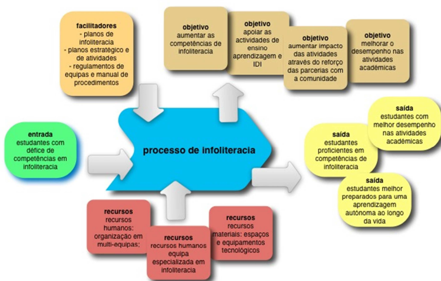
Figura 1: Processo de Infoliteracia na FEUP

Recursos. No que toca aos recursos de apoio a este processo, destacam-se os recursos humanos como um fator crucial para a sua implementação e desenvolvimento. A última alteração orgânica-funcional em 2009 veio possibilitar a criação de uma equipa na área de atividade do Front-office (Equipa de Apoio e Descoberta), no âmbito da qual se formou uma outra equipa afeta a esta área (Equipa de Infoliteracia), que desde então tem desenvolvido um trabalho de fundo e de especialização no domínio da infoliteracia. É uma equipa que se pretende qualificada e altamente motivada para conseguir um elevado nível de desempenho nos serviços prestados, tendo para isso a