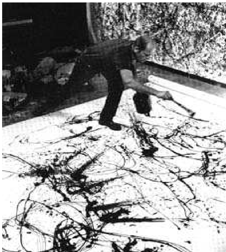
Fig. 2 – Jackson Pollock em trabalho no estúdio, 1950.

(b) Agora, partindo de uma outra imagem [fig.2], em que vemos Jackson Pollock no seu estúdio, numa fotografia realizada em 1950 por Hans Namuth, gostaria de introduzir um texto de Allan Kaprow, a quem é atribuída a paternidade do Happening e respetivos desenvolvimentos.