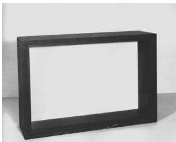
Fig. 1 – António Areal, Caixa nº 6: Em cima, um arquétipo divino com atributos iconograficamente formulados, 1969. Caixa de madeira pintada com face em vidro (coleção do CAMJAP da FCG, Lisboa).

(a) Em primeiro lugar, escolhi esta imagem de um trabalho de António Areal [fig.1], apresentado em 1969 na Galeria Quadrante, em Lisboa, porque me pareceu interessante recorrer a um exemplo atípico. É que estarei provavelmente a fazer uma apropriação abusiva desta obra, mas, como afirmava Foucault, "deve-se conceber o discurso como uma violência que fazemos às coisas, como uma prática que lhes impomos". E o desvio que eu proponho desta obra de António Areal inscreve-se exatamente nessa ordem de ideias.