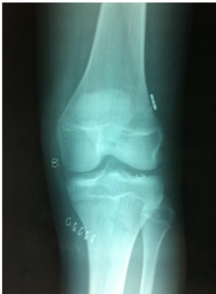
Figura 3 – RX após reconstrução do LCA em doente com imaturidade esquelética. Técnica anatómica e fixação extracortical com botão.