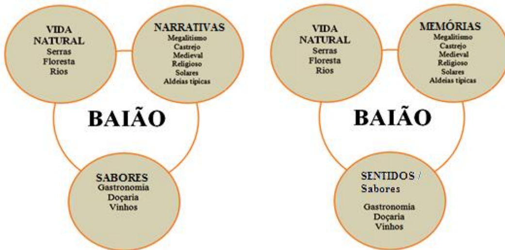
Figura 1 - Eixos potenciais de desenvolvimento turístico

Definindo-se as áreas de intervenção com marcadores que exprimam uma linguagem simbólica uniforme e comum, importa proceder à identificação do património susceptível de integrar os produtos e os serviços associados, de forma estruturada e coerente. Este balizamento permite corporizar as medidas de estratégia maximizando a relação dos turistas com o território e contribuindo, numa perspectiva local, para valorizar os espaços tanto públicos como privados.