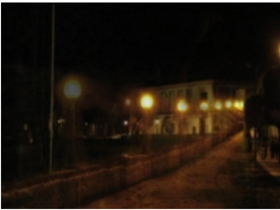
Frame do vídeo 1

Vídeo 2 — Multiplicação de elementos arquitectónicos que conquistam o espaço não só como palco mas sobretudo como actores.