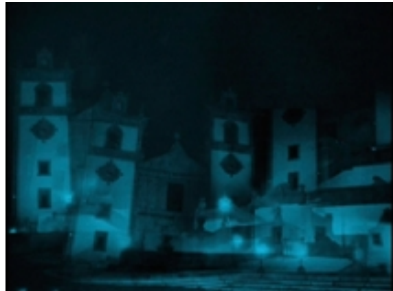
Frame do vídeo 2