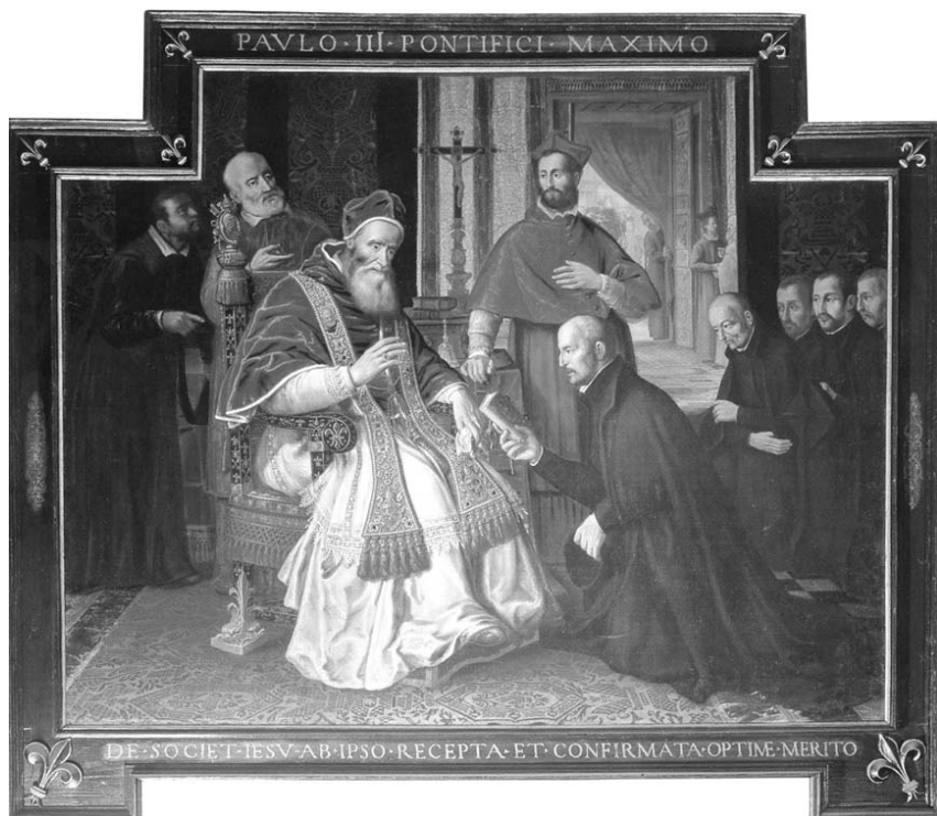
Fig. 1 – Santo Inácio e Paulo III na aprovação da Companhia de Jesus. Anónimo. Sacristia do Gesù - Roma.

Companhia: Todo aquele que pretende alistar-se sob a bandeira da Cruz, na nossa Companhia, que desejamos se assinalar com o nome de Jesus para combater por Deus e servir somente o Senhor e ao Romano Pontífice, seu Vigário na terra, depois do voto solene de perpétua castidade persuada-se que é membro da Companhia 4 .