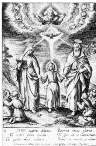
Fig. 3 – A Trindade Celeste e a Trindade Terrestre, uma devoção promovida pela Companhia de Jesus Hieronimus Wierix, Séc. XVI.