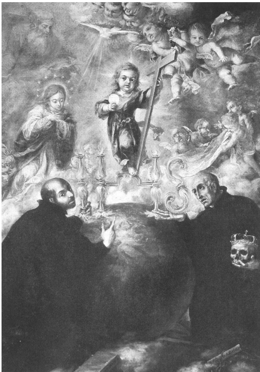
Fig. 6 – Santo Inácio de Loiola e S. Francisco de Borja e Alegoria da Eucaristia. Juan de Valdés Leal. Museu de Belas Artes de Sevilha.