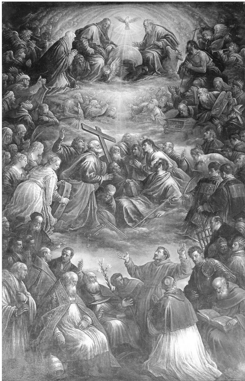
Fig. 5 – Adoração da Santíssima Trindade. Jacopo da Ponte. Capela da Trindade do Gesù, Roma.