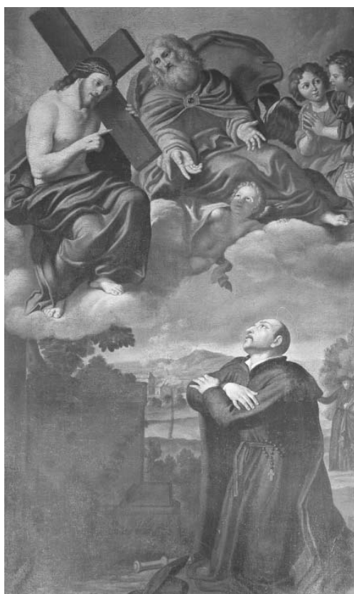
Fig. 4 – Santo Inácio e a Visão de “Storta”. Domenichino e colaboradores - Capela Farnese da Casa provincial de Roma.