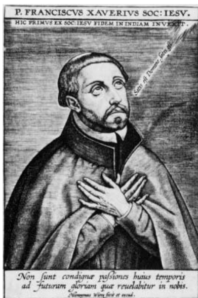
Fig. 10 – Quatro primeiros Santos da Companhia de Jesus: Santo Inácio de Loiola (1622), S. Francisco Xavier (1622), S. Francisco de Borja (1671), S. Luis Gonzaga (1726) Gravuras de Hieronymus Wierix, Séc. XVI.