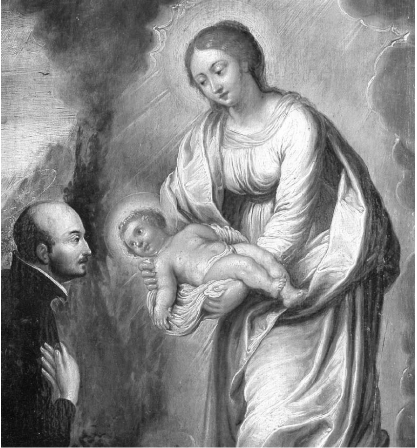
Fig. 7 – Santo Inácio e a sua devoção à Virgem com o Menino. Jan de Vos. Séc. XVII.

da igreja do Gesù , passou a ter nela um altar reservado. Depois de ter recebido a ordenação sacerdotal, em Veneza, Inácio quis celebrar a sua primeira missa na basílica de Santa Maria Maior, que, para além da relíquia das tábuas da gruta de Belém, guardava o ícone milagroso da Salus Populi Romani .