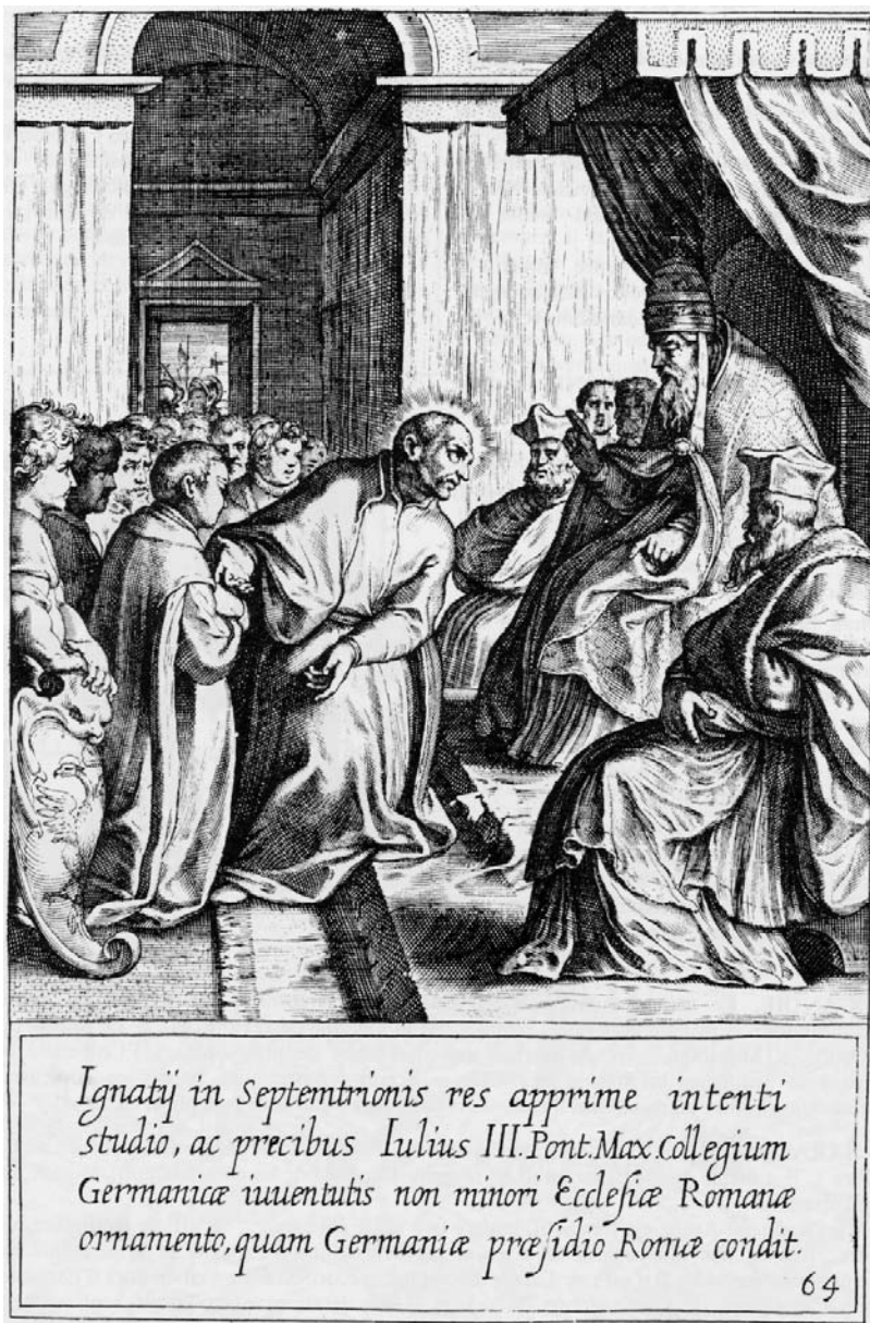
Fig. 2 – Santo Inácio apresenta a Júlio III o projecto do Colégio Germânico. P. P. Rubens - J. B. Barbé - Vita Beati P. Ignatii Loiolae, 1609.