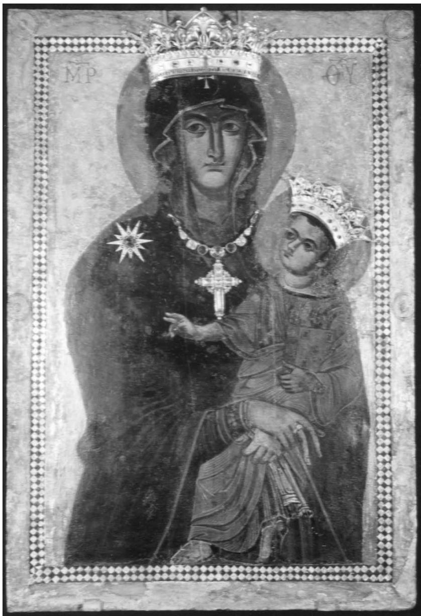
Fig. 9 – Salus Populi Romani. Séc. XII-XIII. Roma, Basilica de Santa Maria Maior.