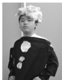
ペリーになりきる