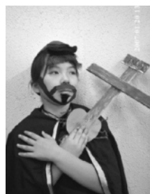
ザビエルになりきる