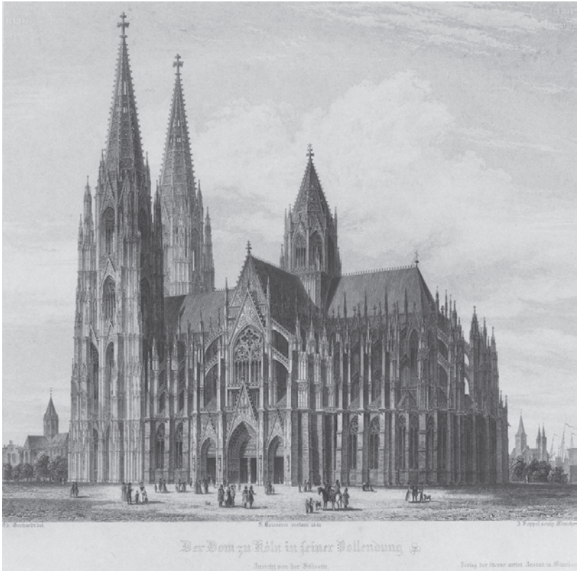
Abbildung 1: S. Boisserée, Geschichte und Beschreibung des Doms zu Köln, 1842, Frontispiz

Seit 1821 gibt der Kölner Kaufmannssohn und Privatgelehrte Sulpiz Boisserée seine großformatige, mit Kupferstichtafeln ausgestattete Monographie zum Kölner Dom heraus, die unter dem Titel Ansichten, Risse und einzelne Theile des Doms von Köln, mit Ergänzungen nach dem Entwurf des Meisters, nebst Untersuchungen über die alte Kirchen-Baukunst und vergleichenden Tafeln der vorzüglichsten Denkmale nicht nur zu ihrer Zeit mit großer Aufmerksamkeit wahrgenommen, sondern sogar Berühmtheit erlangen wird. Im Textband der zweiten Auflage Geschichte und Beschreibung des Doms zu Köln von 1842 findet sich als Frontispiz eine Ansicht der Kathedrale von Südosten (Abbildung 1).