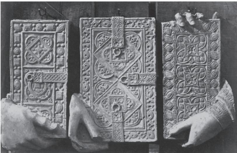
Abbildung 4: Ch. Nègre, Abgussfragmente von Skulpturen am Südquerhaus der Kathedrale von Chartres, 1853/57