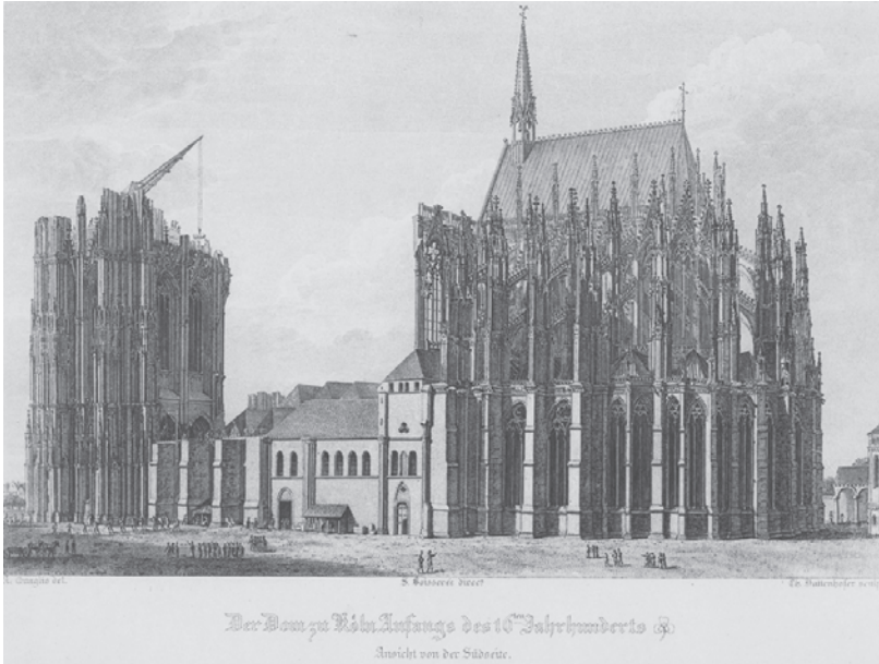
Abbildung 2: S. Boissérée, Geschichte und Beschreibung des Doms zu Köln, 1842, Tafel

den des Originalplans 1817 korrigiert. Die besten Zeichner, Stecher und Drucker wurden engagiert, um schließlich Resultate präsentieren zu können, die alles in den Schatten stellten, was bis dahin publiziert worden war. Die suggestive Veranschaulichung des imposanten Bauwerks, von den Zeitgenossen mit Goethe an der Spitze enthusiastisch gefeiert, lässt schnell vergessen, dass hier nicht etwa die genaue Aufnahme eines gotischen Bauwerks vorliegt, sondern diese in mehrfacher Hinsicht von der Vorlage, also der existierenden Architektur, abweicht. Am deutlichsten wird dies, wenn wir die aus Untersicht besonders monumental wirkende Kathedrale mit dem Zustand der Kirche in der Zeit um 1840 vergleichen, die zu weniger als zur Hälfte fertiggestellt war und genau so nur ein paar Seiten weiter im selben Buch auch erscheint (Abbildung 2). Boissérées erste Ansicht ist also eine Projektion, sowohl rückwärts wie vorwärts gewandt: Sie orientiert sich an mittelalterlichen Baurissen und stellt einen Zustand vor Augen, der irgendwann einmal zu realisieren wäre. Damit erweist sich das Bild als eine Idee vom Original, mit der argumentiert wird, die aufrütteln soll und nicht zuletzt auf die Vollendung dessen setzt, was noch unvollendet ist.