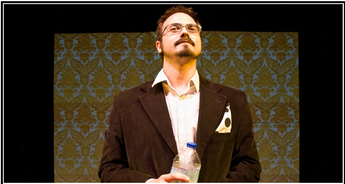
Liseo. Escena 1.7. La dama boba , versión para no versados. Compañía Espaciomaginado

liseo Lástima me ha dado a mí, considerando que ponga en un cuerpo tan hermoso el cielo un alma tan loca. ¿qué puede parir de mí sino monos, leones y ocas? Las bodas no han de seguir, hoy la palabra se rompa, rásguense cartas y firmas, que ningún tesoro compra la libertad. ¡Aún si fuera Nise... hermana hermosa! Pues, ¿he de dejar la vida por la muerte temerosa, y por la noche enlutada el sol que los cielos dora? Desde aquí y sin retorno renuncio a la dama boba. (Se va)