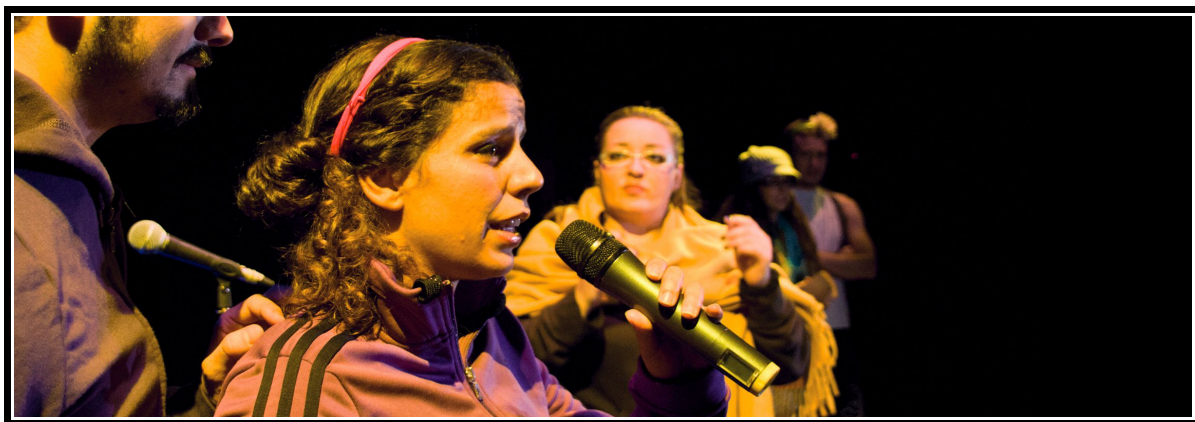
Finea. Prólogo. La dama boba , versión para no versados. Compañía Espaciolmaginado

Finea se queda sola cantando torpemente mientras la escena cambia para comenzar el primer acto.