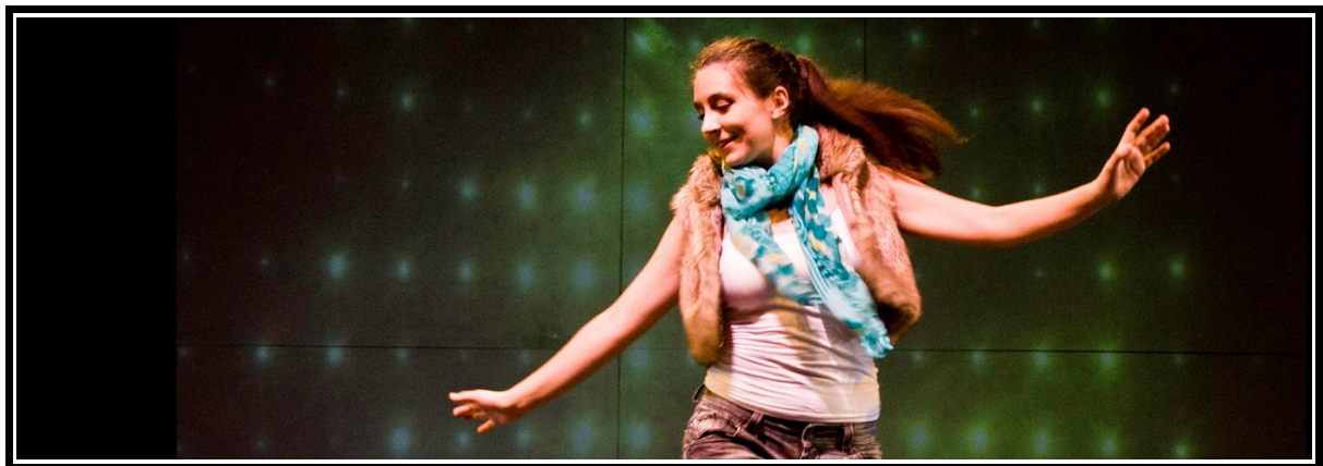
Nise. Escena 3.3. La dama boba , versión para no versados. Compañía EspaciImaginado