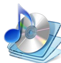
base alternativa 2