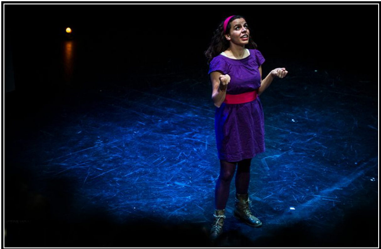
Finea. Escena 3.5. La dama boba , versión para no versados. Compañía EspacioImaginado

la oscuridad de mi ingenio; tú fuiste el divino genio que me enseñaste y me diste la luz con que me pusiste el nuevo ser en que estoy. Mil gracias, Amor, te doy, pues me enseñaste tan bien, que dicen cuantos me ven que tan diferente soy. Ya puedes del grado honrarme, dándome a Laurencio, Amor, con quien pudiste mejor, enamorada, enseñarme. (Se va)