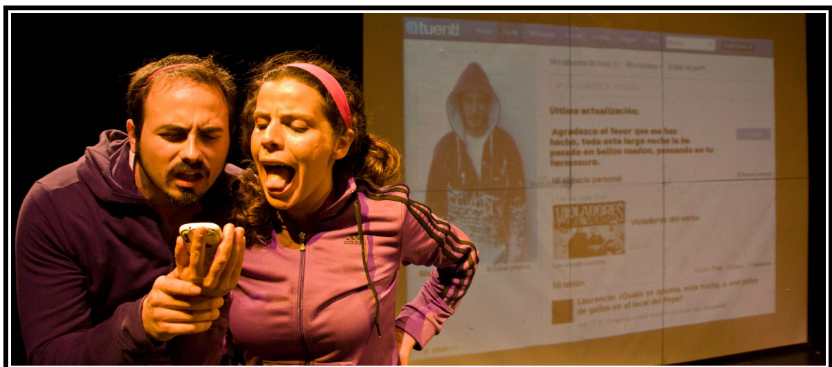
Finea y Clara. Escena 2.4. La dama boba , versión para no versados. Compañía EspaciImaginado

finea Yo no entiendo cómo ha sido, desde que el hombre me habló; porque, si es que siento yo, él me ha llevado el sentido. Si duermo, sueño con él; si como, le estoy pensando, y si bebo, estoy mirando en agua la imagen de él.