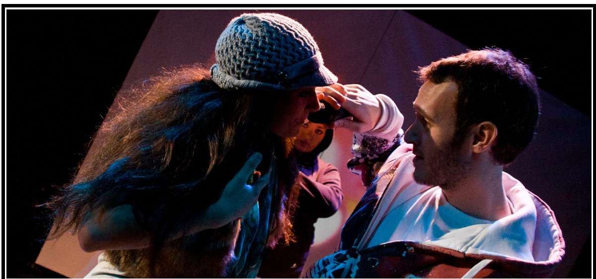
Nise y Laurencio. Escena 1.3. La dama boba , versión para no versados. Compañía Espaciolmaginado