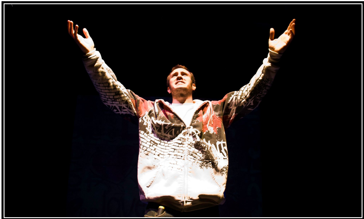
Laurencio. Escena 3.11. La dama boba , versión para no versados. Compañía Espaciolmaginado

a Lau Ya puedes del grado hon rarme, dándome con qui rencio, A mor, en pu diste me jor, enamo rada, ense ñar me. enamo rada, ense ñar me. enamo rada, ense ñar me.