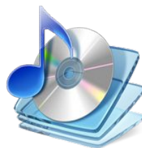
base alternativa 1