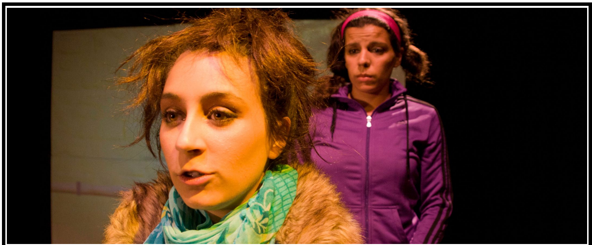
Finea y Nise. Escena 2.6. La dama boba , versión para no versados. Compañía Espaciolmaginado

Con desenamorarse, si hay agravio, que es el remedio más prudente y sabio;