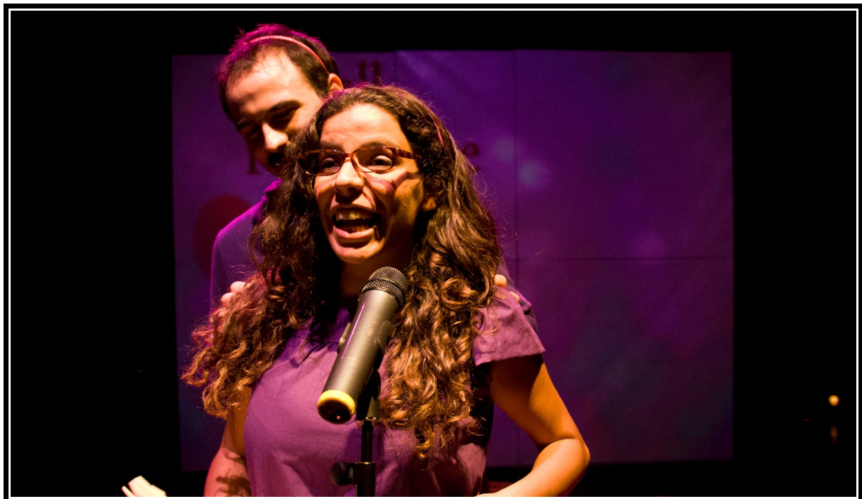
Clara y Finea. Escena 3.1. La dama boba , versión para no versados. Compañía Espaciolmaginado

Formad un grupo y escoged varias escenas de la obra. Elegid el papel de director y de los distintos actores que van a representar los personajes y poned en pie las palabras de Lope. Un consejo: leed atentamente el texto y entended bien lo que está ocurriendo en todo momento. Una buena puesta en escena parte de la profunda comprensión de las motivaciones de cada uno de los personajes y del objetivo narrativo de la escena. Y un consejo más: un buen trabajo de grupo, bien coordinado y con aportaciones de todos los miembros, siempre tiene resultados escénicos brillantes.