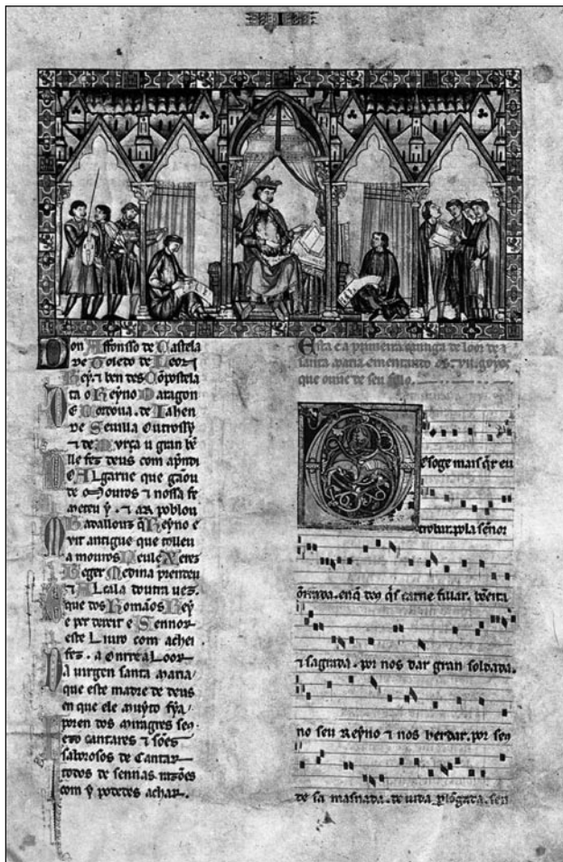
Códice T.I.1 folio 5º

Las Cantigas de Santa María, compuestas bajo el mandato de Alfonso X, son una colección de canciones monódicas, en lengua gallega, que cantan las virtudes de la Virgen y narran los milagros alcanzados por intercesión suya.