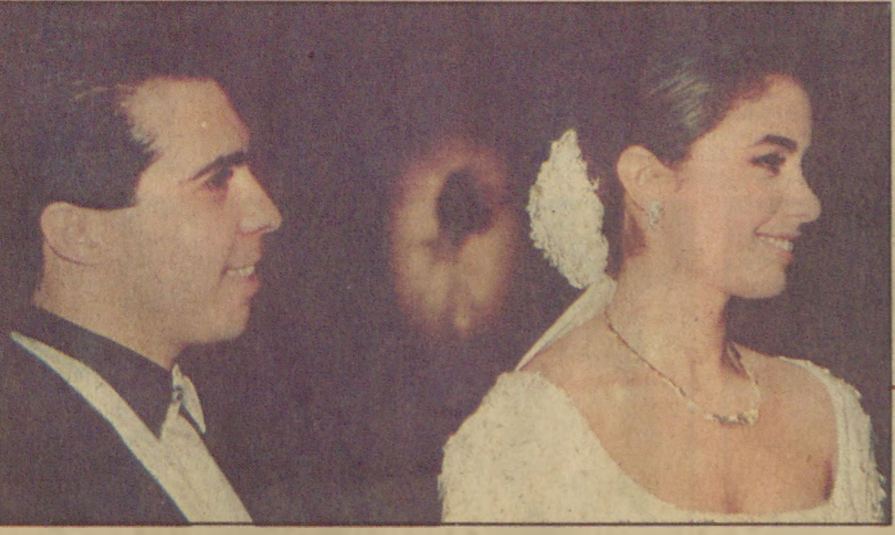
Düğünde Efe ile Zeynep'in mutlulukları yüzlerinden okunuyordu.

Semra Özal mı, Talat Yılmaz mı? Kördüğüm bugün İstanbul il kongresinde çözülüyor