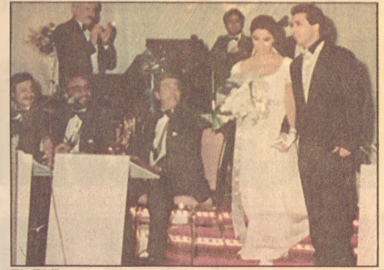
EL ELE Şeref masasının ünlü konukları arasında 7. Cumhurbaşkanı Kenan Evren de vardı. Cumhurbaşkanı Turgut Özal ve eşi Semra Özal, kutlamaları kabul ederken, Kenan Evren de konuklarla tokalaştı, hal-hatır sordu (yanda). Efe ve eşi Zeynep'in salona el ele girişlerinde tüm gözler onlara çevrildi. Genç çift, orkestra eşliğinde ve alkışlar arasında yürüyerek ilk danslarını yaptı.

'MUTLULUKLAR' Nikâhın kıyılmasının ardından genç çifti ilk tebrik edenler, kayınpederleri ile kayınvalideleri oldu. Cumhurbaşkanı Turgut Özal, yeni gelini Zeynep'i öperek kulladı ve mutluluklar diledi.