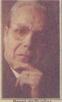
Perez de Cuellar

●Laftan baska bir sey yapmayan yabancı ülkelere göre sığınmacılara kat kat fazla yardım eden, sınırlarını, gümrüklerini, hac tesislerini, köylerini, evlerini açan, yemegini, ilacini paylaşan Türkiye, dünya kamuoyunda adeta kaybeden taraf oldu. Çünkü, yaptıklarını anlatamadı, sesini duyduramadı