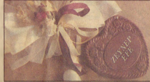
ÖZEL ÇİKOLATA Yılın düğününde Fransız şampanyasıyla birlikte pasta ve kalp şeklinde üstünde "Zeynep-Efe" yazılı İsviçre çikolataları sunuldu.