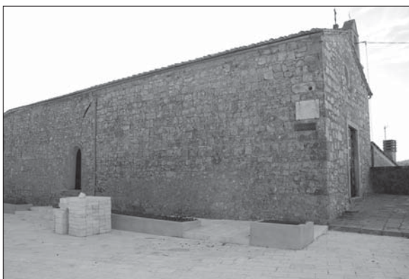
Prospetto Particolare 1

Porzione Nord-Ovest della chiesa di S. Croce. È evidente dal PP1 il taglio e il reinserimento dell'attuale facciata. Quest'ultima non ha fasi medievali ma contiene elementi architettonici di reimpiego (come cunei d'arco in travertino). Il materiale da costruzione è principalmente calcare ma si registra la presenza di arenaria, travertino e laterizi.