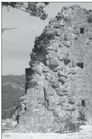
Prospetto Particolare 9