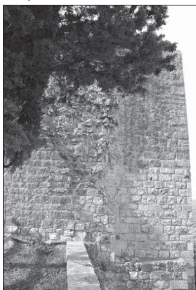
Prospetto Particolare 8

La feritoia presenta conci squadrati e spianati, mentre la finitura bugnata si riferisce alle angolate. La feritoia sembra in fase con la muratura di fase 1, a differenza del PP1: è possibile che l'intervento di fase 2 sulla feritoia abbia riguardato solo il prospetto interno.