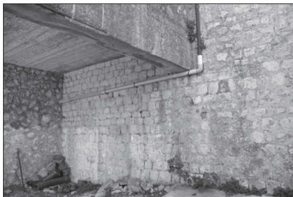
Prospetto Particolare 1

Alla luce delle informazioni ricavabili da questo setto murario, il CF1 come chiesa viene a collocarsi sulla cortina muraria dismessa delle antiche fortificazioni.