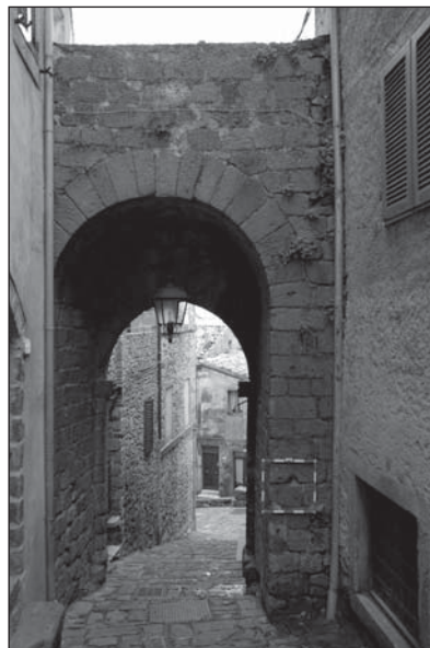
Prospetto Particolare 2