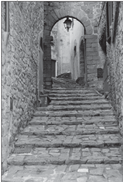
Prospetto Particolare 1