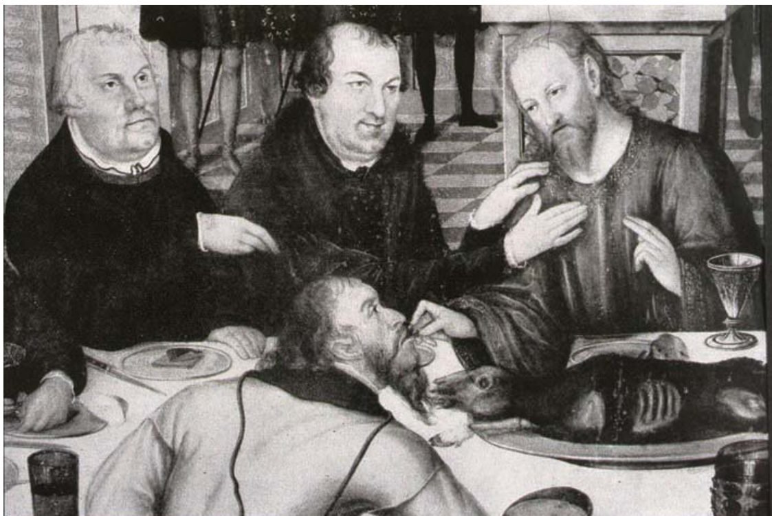
Fig. 2 Dessauer Altar , particolare, in O. Thulin, Cranach-Altäre der Reformation , Berlin 1955, Fig. 121.