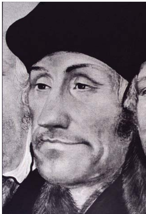
Fig. 23 Epitaph des Michael Meyenburg, Erasmus von Rotterdam, in Thulin, Cranach-Altäre, Fig. 109.