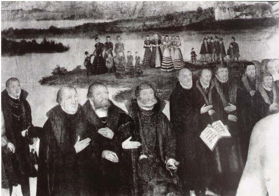
Fig. 20 Epitaph des Fürsten Wolfgang von Anhalt , particolare, in Findeisen, Bildnisse , Fig. 5.