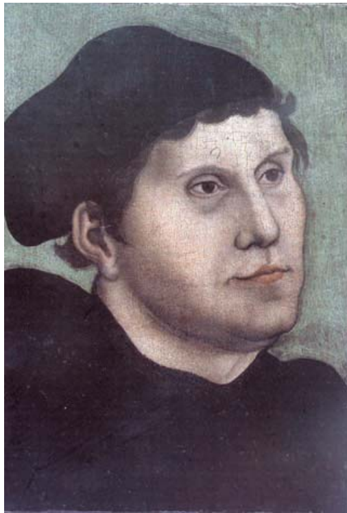
Fig. 17 Lucas Cranach d. Ä., Bildnis Martin Luthers (intorno al 1520), in Galerie Trost. Gemälde Alter Meister – Klassische Moderne – Ausgesuchtes Mobiliar des 18. und frühen 19. Jahrhunderts , München 2002, p. 10, Fig. 2.