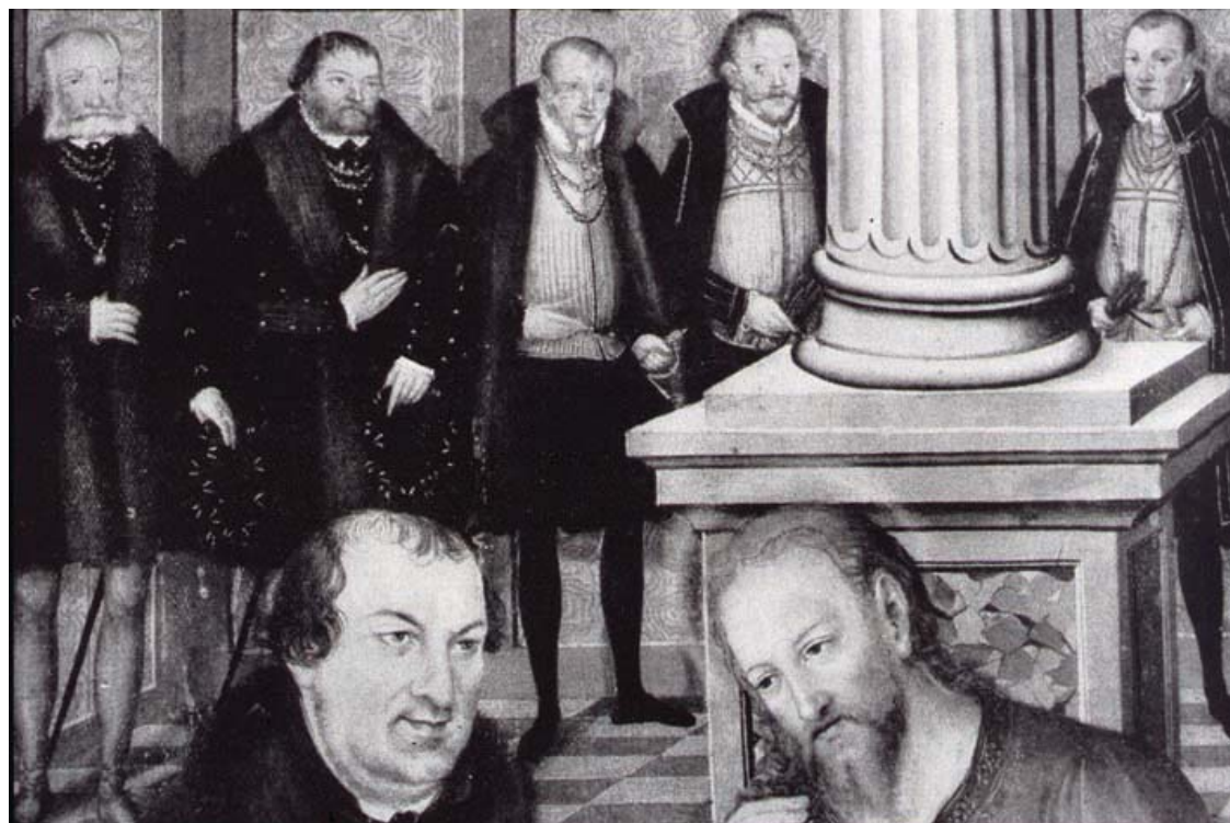
Fig. 3 Dessauer Altar , particolare, in Thulin, Cranach-Altäre cit. , Fig. 122.