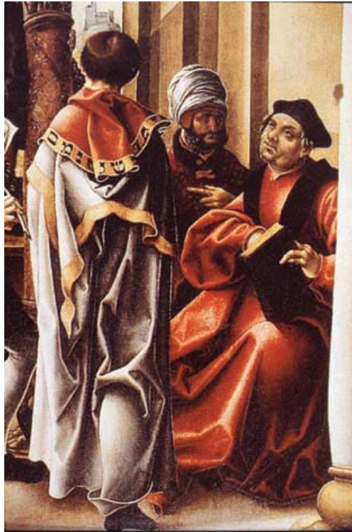
Fig. 16 Jörg Breu d. Ä., Die Verbreitung der Musik , particolare, in Bushart, Fuggerkapelle , Tav. XIII.