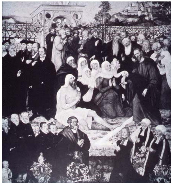
Fig. 21 Lucas Cranach d. J., Epitaph des Michael Meyenburg (un tempo in Nordhausen), in Thulin, Cranach-Altäre , Fig. 97.