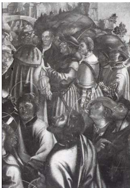
Fig. 14 Jörg Breu d. Ä., Aufnahme Mariens in den Himmel , particolare, in Bushart, Fuggerkapelle , Fig. 140.