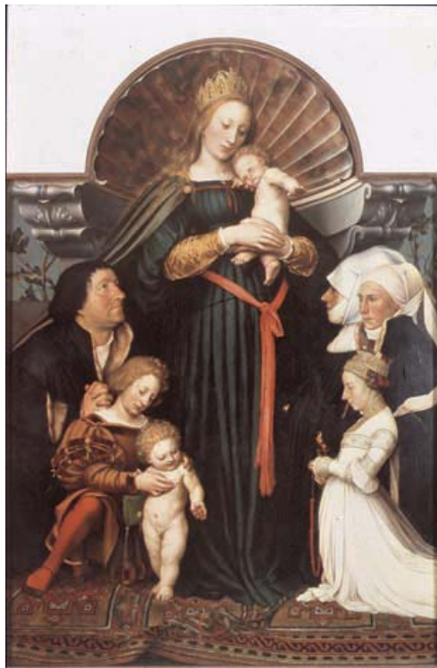
Fig. 6 Hans Holbein d. J., Darmstädter Madonna (1526/28), in Hans Holbein der Jüngere 1497/98 – 1543, Porträtist der Renaissance , Stuttgart 2003, p. 55.