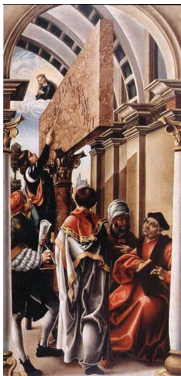
Fig. 15 Jörg Breu d. Ä., Die Verbreitung der Musik , Cappella Fugger di Augusta, in Bushart, Fuggerkapelle , Tav. XIII.