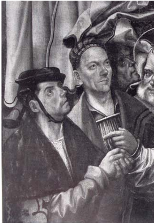
Fig. 12 Jörg Breu d. Ä., Himmelfahrt Christi , particolare, in Bushart, Fuggerkapelle , Fig. 137