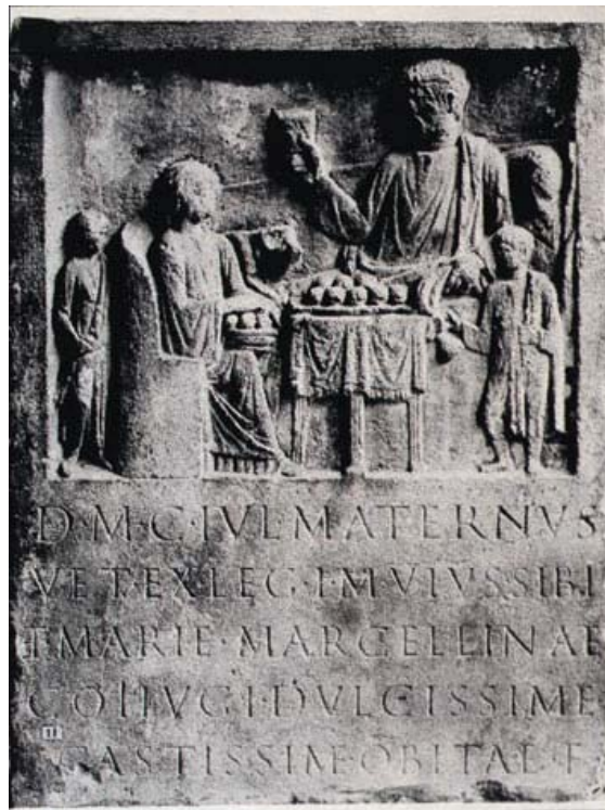
Fig. 4 Pasto funebre romano su pietra tombale (Colonia, I secolo d.C.), in Gedächtnis, das Gemeinschaft stiftet , hrsg. von K. Schmid, München/Zürich 1985, p. 89, Fig. 1.