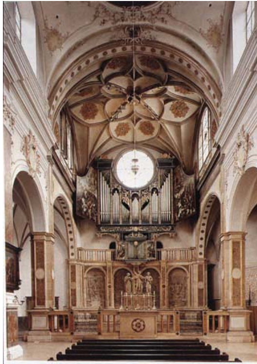
Fig. 10 Cappella commemorativa dei Fugger presso la chiesa di S. Anna di Augusta, in B. Bushart, Die Fuggerkapelle , München 1994, Tav. IV.