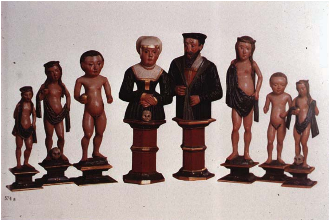
Fig. 24 Die Familie des Grafen Anton von Ysenburg (intorno al 1550), nel catalogo Hessen und Thüringen. Von den Anfängen bis zur Reformation. Eine Ausstellung des Landes Hessen , Marburg 1992, p. 319, Fig. 574a.