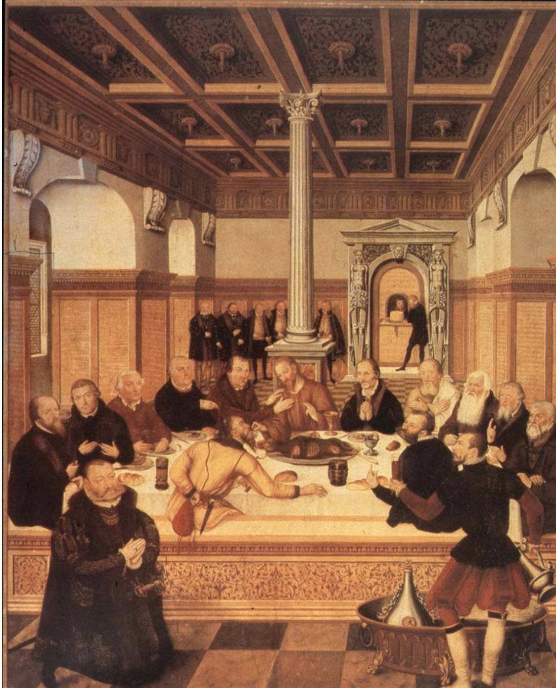
Fig. 1 Lucas Cranach d. J., Dessauer Altar (1565), in Kunst der Reformationszeit , Berlin 1983, p. 392.