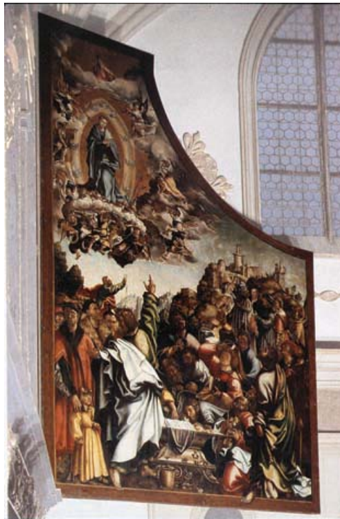
Fig. 13 Jörg Breu d. Ä., Aufnahme Mariens in den Himmel , in Bushart, Fuggerkapelle , Tav. XI.