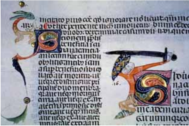
Fig. 12 - Karlsruhe, Badische Landesbibliothek, Ms Aug. Perg. 1, f° 16v Lettres initiales décorées S ( Si duobus... ); S ( Si duobus... ) © Karlsruhe, Badische Landesbibliothek.

Bologne et récemment au milieu toulousain 53 , on y retrouve les mêmes têtes avec des barbes ou des queues (fig. 12).