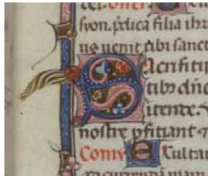
Fig. 9 - Londres, British Library, Additional 17006 (Missel d'Auger de Cogeux), f o . 13r Lettre initiale décorée S ( Sacrificii... ) © British Library Board.

Des petites têtes barbues et avec des queues se reconnaissent en effet dans les pages d'un précieux Missel (fig. 9), conservé à la British Library (ms. Additional 17006 42 ), datable du début du XIV e siècle, vraisemblablement réalisé dans la région comprise entre Toulouse et Narbonne 43 . Le Missel a été confectionné à l'instigation de l'abbé Auger de Cogeux (en charge de 1279 à 1308 44 ) pour la chapelle de Saint-Barthélemy 45 de l'abbaye de Sainte-Marie de Lagrassie dans