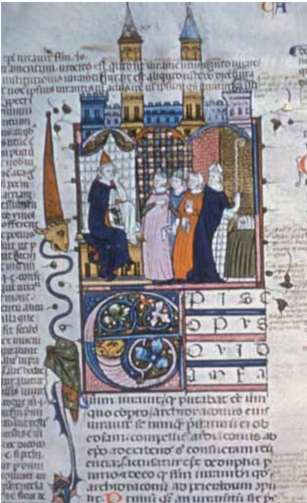
Fig. 2 – Causa XXII , Un évêque mis en cause pour avoir commis un parjure; Détroit, The Detroit Institute of Art, N. 61.248, recto (détail) © The Detroit Institute of Art.

Bibliothèque municipale de Toulouse 23 ; le fragment déjà cité du bréviaire choral conservé à la Bibliothèque nationale de France (ms. nouv. acq. lat. 2511, f o 39v o , 18v o , 117r o , 69r o ) 24 ; le raffiné missel à l'usage des Dominicains provenant du couvent toulousain des Jacobins, ms. 103 de la Bibliothèque municipale de Toulouse 25 (fig. 5); un autre codex vraisemblablement toulousain incluant le texte de la Légende dorée de Jacques de Voragine, datable des mêmes années, aujourd'hui à la