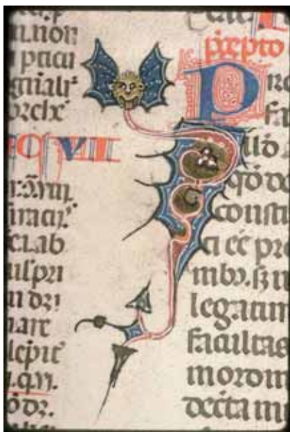
Fig. 7 - Avignon, Bibliothèque Municipale, ms. 659, f. 69v, Lettre initiale décorée Q ( Quid... ) © CNRS-IRHT, Bibliothèque Municipale d'Avignon.

Ce répertoire de figures grotesques, si caractéristique de la production languedocienne de la fin du XIII e siècle, persiste en effet dans les manuscrits toulousains pendant une grande partie du XIV e 36 . Outre le Décret de Gratien