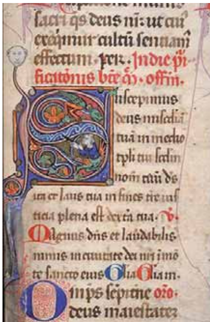
Fig. 5 – Toulouse, Bibliothèque Municipale, ms. 103, Missel à l’usage dominicain, provenant du couvent des Jacobins de Toulouse, f o . 223r, Lettre initiale décorée S ( Suscipimus deus... ) © G. Boussières Mairie de Toulouse.

Bibliothèque Apostolique Vaticane (ms. Reg. lat. 534, f o 28r 26 ) et enfin certains folios du Décret reconstitué, évoqué précédemment ( Causae III, XV, XXII, XXVIII, XXIX, XXXIV), dans lesquels se retrouvent les mêmes figurines, dans des formes plus mûres et élaborées, occupant les anses de nombreuses initiales (fig. 1, 2).