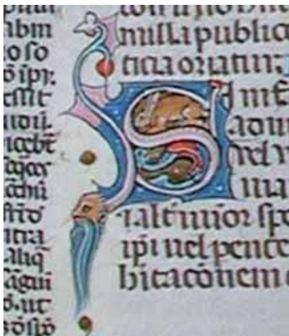
Fig. 10 – Brescia, Biblioteca Civica Queriniana, Ms B I 1, f.° 79r, Lettre décorée S ( Si nisi... )

l'Aude 46 . Le même répertoire drôlatique se retrouve aussi dans une copie du sixième livre des Décrétales de Clément V avec Glose ordinaire de Giovanni d'Andrea (Brescia, Biblioteca Civica Queriniana, ms. B I 1, fol.° 79r, 88v, 116r), initialement localisée à Avignon 47 , récemment réattribuée à un domaine de production toulousain 48 , stylistiquement liée au Missel de Cogeux 49 et datable autour de 1320. Le manuscrit présente des motifs du répertoire décoratif qui ressemblent à ceux du Missel de Cogeux, tant pour leur dimension que pour leur disposition tout au long du texte : on y retrouve les élégants et rigoureux quadrillages des fonds des initiales, les têtes barbues (fig. 10), les figures d'animaux, peintes en rouge, renfermées dans les anses des initiales et les figures d'animaux qui sont vêtues de curieux manteaux (fig. 11). Le même vocabulaire ornemental se reconnaît encore dans deux autres exemplaires de Décrétales liés stylistiquement au Missel de Cogeux : dans le