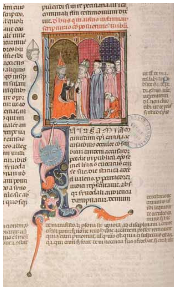
Fig. 8 - Amiens, Bibliothèque Municipale, ms. 355, f. 146v, Causa V, Un évêque est mis en accusation et fait appel contre la sentence prononcée © CNRS-IRHT, Bibliothèque d'Amiens Métropole.

avignonnais (ms. 659) déjà cité et celui de la Bibliothèque municipale d'Amiens, ms. 355 37 (fig. 8), d'un style plus italianisé, témoin de l'influence exercée par les manuscrits juridiques enluminés de Bologne sur la production toulousaine, on peut rapprocher de cet ensemble une vingtaine de feuillets décorés, appartenant primitivement au manuscrit toulousain du Décret