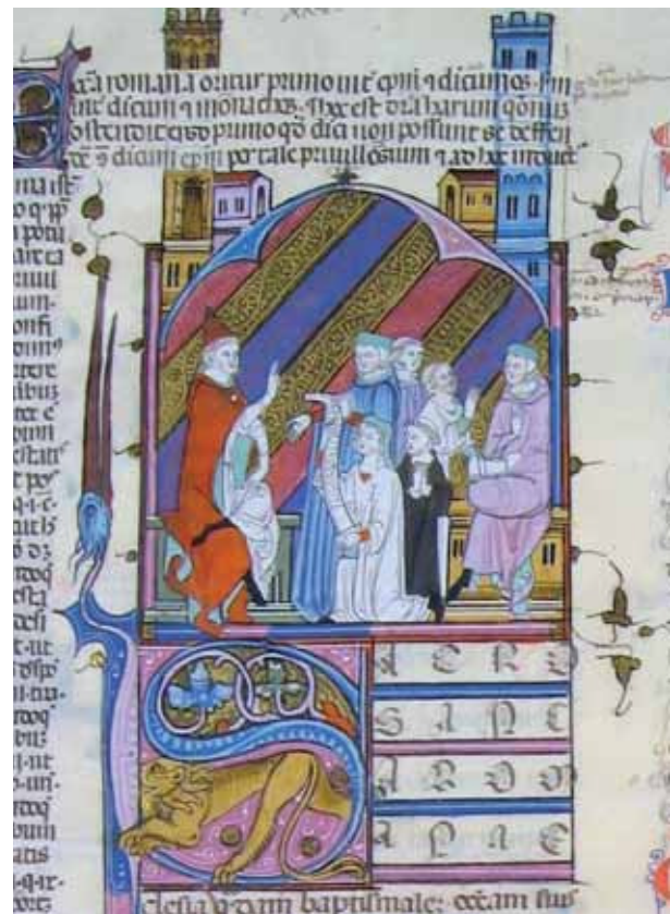
Fig. 4 – Causa XXV , Les revenus des moines provenant d'une église baptismale placée sous leur juridiction sont contestés par des ecclésiastiques séculiers; olim Ambourg, Jorn Gunther, autrefois Collection Lehman M34