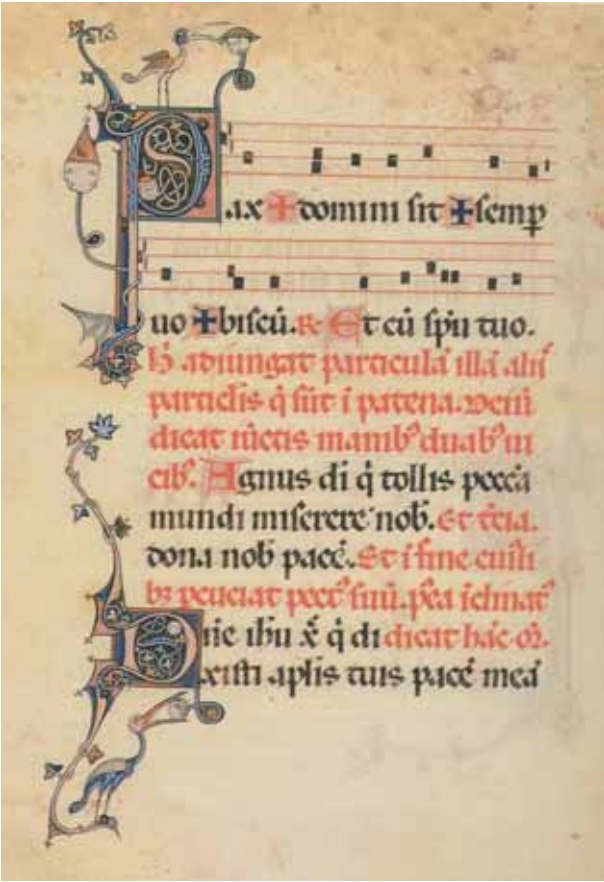
Fig. 6 – Cité du Vatican, Biblioteca Apostolica Vaticana, Arch. S. Pietro B. 76 (Missel du pape Clément V), f o . 132 v, Lettre initiale décorée P ( Pax domini... ), incipit de l'antiphone à la Communion; Lettre initiale décorée D ( Domini Ihesu... ) incipit de la prière pour la Communion © 2010, Biblioteca Apostolica Vaticana.

toulousaine, datable de la décennie 1300-1310, possédée à la fin du XIV e siècle par Jean de Cardaillac, patriarche d'Alexandrie et archevêque de Toulouse, puis donnée à la cathédrale Saint-Étienne et actuellement conservée à la Württembergische Staatsbibliothek de Stuttgart (ms. Cod. Bibl. 2 o 8, f o 310v 30 ) et de tout un groupe de manuscrits provenant du Sud-Ouest, plus particulièrement de Toulouse 31 . La décoration peinte du Pontifical du pape Clément V, caractérisée par un langage formel influencé par des éléments de diverses origines, méridionaux et septentrionaux 32 , dénote une évidente connaissance de l'enluminure toulousaine des années 1300-1320, et semble donc être essentiellement le fait d'une équipe d'artistes, en partie de formation toulousaine, qui a travaillé dans la région avignonnaise dans un milieu culturellement ouvert et vivant comme l'était celui de la cour pontificale.