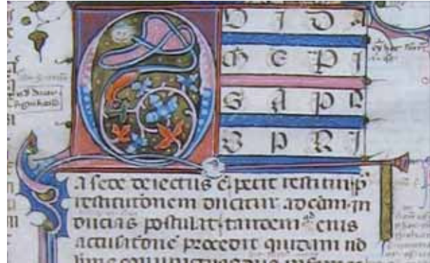
Fig. 3 – Causa III , Lettre initiale décorée Q ( Quidam episcopus... ); Londres, Collection privée, olim Jorn Gunther, autrefois Collection Lehman M 35 (détail)