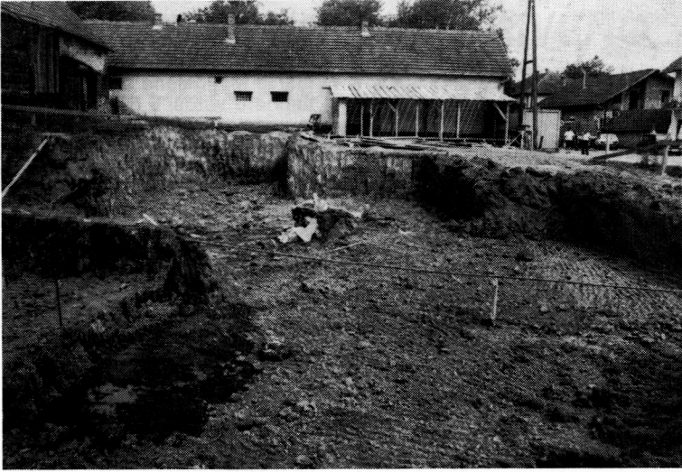
1 ČAZMA-Tržnica (središnji i istočni dio)