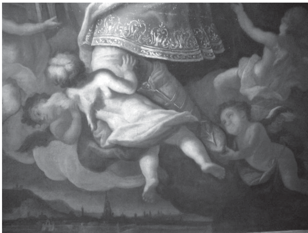
1. i 3. Paulus Antonius Senser, Sv. Leopold , i detalj, nakon 1751., ulje na platnu, 180 x 130 cm, oratorij kapucinskog samostana sv. Jakova u Osijeku / Paulus Antonius Senser, St Leopold , and detail, after 1751, oil on canvas, 180 x 130 cm, oratory of the Capuchin monastery of St James in Osijek

mo vladajuće Habsburgovce. Kao protagonisti tridentskih poruka u umjetnosti na cjelokupnom teritoriju Monarhije učestalije se javljaju neki od njihovih Hausheiligena – među kojima sv. Josip, sv. Terezija Avilska, sv. Ivan Nepomuk, sv. Leopold – kao potvrda katoličke propagande, ali i političke moći vladara. 4 Snažan zalag za širenje njihova čašćenja, pa i upisa na listu svetaca, podupirala je umjetnost u svim medijima, prepoznatljiva i u hrvatskoj likovnoj baštini. Tako su kamene javne skulpture sv. Ivana Nepomuka, čije su procese beatifikacije i kanonizacije Habsburgovci inicirali, 5 posebno razgranate po graničnim rubovima Carstva, poput svojevrsne vjerske obrane teritorija i naroda. 6 Zagovor Dvora u promidžbi čašćenja sv. Josipa, 7 koji 1687. godine postaje i zaštitnik Kraljevine Hrvatske, 8 također je urodio mnogobrojnim likovnim rješenjima: upravo svečev uzor blage i pobožne smrti pronalazimo na oltarnim slikama duž cijeloga hrvatskog teritorija. 9 Na popularizaciju sv. Josipa u carskoj obitelji i širom Monarhije posredno je utjecala i sv. Terezija Avilska, koja mu u obnovi karmelićanskoga trećeg reda posvećuje dvanaest samostana i snažno propagira kult njegova čašćenja, posebno u Španjolskoj. 10 Sveticu s austrijske baštinske pozornice 11 na hrvatsku uvodi njezina štovateljica i imenjakinja, carica Marija Terezija Habsburg (1740.–1780.). 12 Tragovi caričine direktne »upletenosti« u