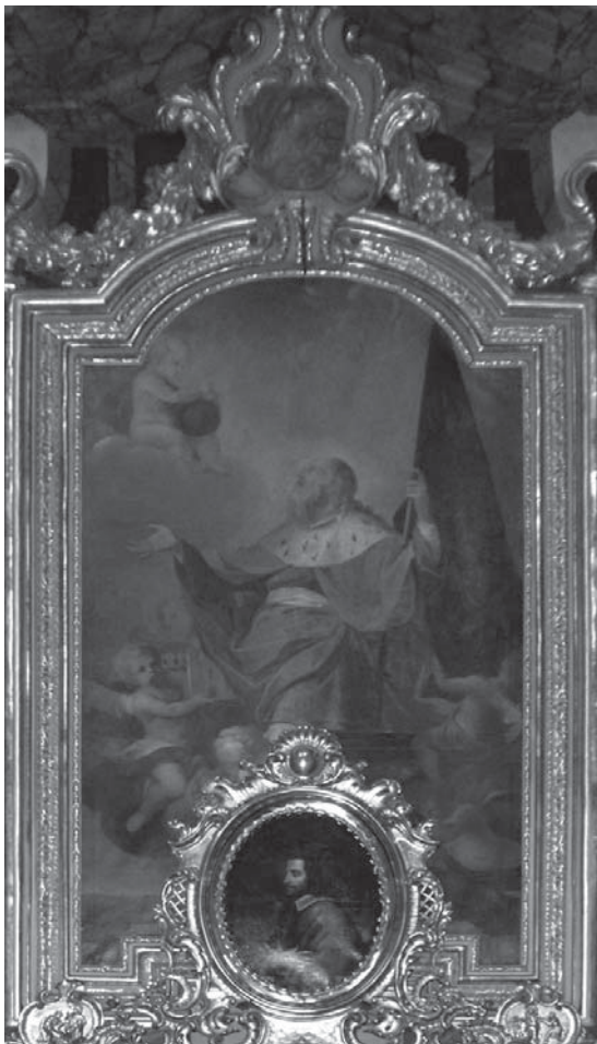
2. Suradnici Andrea Pozza (?), Apoteza sv. Leopolda , između 1703.–1709., ulje na platnu, 380 x 230 cm, isusovačka crkva, Beč / Collaborators of Andrea Pozzo (?), Apotheosis of St Leopold , 1703–1709, oil on canvas, 380 x 230 cm, Jesuit church, Vienna

pisuje osječkom slikaru Paulusu Antoniusu Senseru (oko 1718. – Pécs, 8. I. 1758.). 40