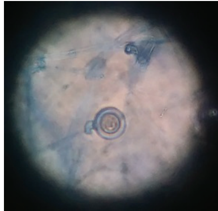
Slika 7. Oogonij, anteridij, oospora

Ta morfološka obilježja dokazuju da je to Pythium vrsta (Krobel 1985).