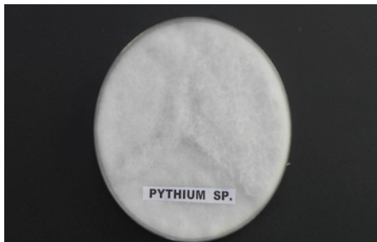
Slika 5. Pythium sp.– čista kultura na KDA podlozi

Na korijenu uzoraka salate iz akvaponskog uzgoja mikroskopskim pregledom ustanovljene su neseptirane hife koje su prožimale korjenčiće. U vidnom polju