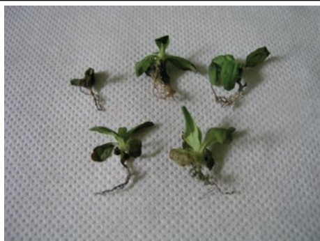
Slika 1. Zaražene biljke matovilca