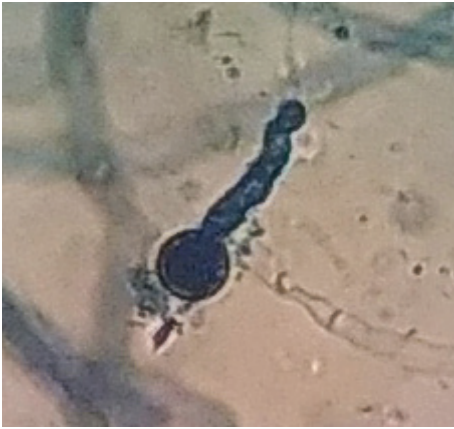
Slika 6. Sporsangij