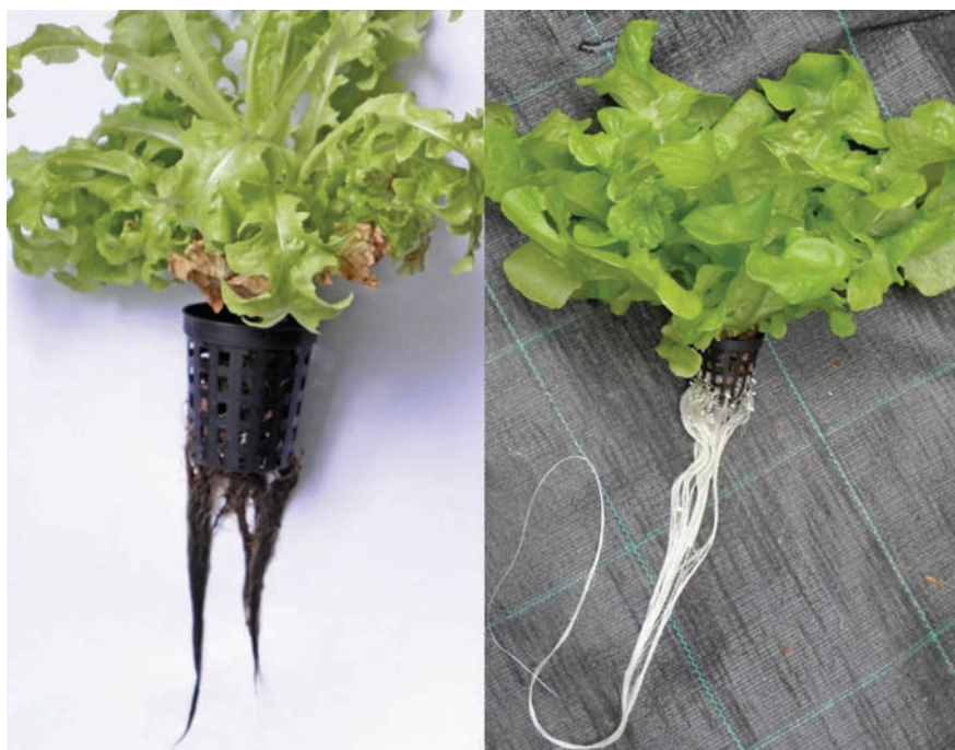
Slika 3.a. zaražen korijen i 3.b. zdravi korijen salate

Tvrtka Luxar AG d.d. kraj Zaprešića proizvodila je salatu kristalku, sortu Tourbillon RZ , u plutajućem hidroponu. U 2012. zabilježena je pojava plamenjače ( Bremia lactucae ) i sive plijesni ( Botrytis cinerea ) na listovima, a u drugom turnusu pojavila se trulež korijena. Biljke su gubile turgor zbog smanjene aktivne površine korijena. Početne promjene na korijenu vidljive su samo na vrhovima korjenčića kao svijetle smeđe lezije. Vremenom su lezije postajale sve veće i poprimile su tamnije smeđu boju.