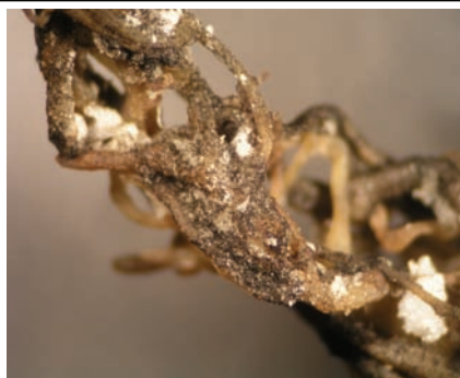
Slika 2. Detalj zaraženog korijena