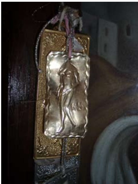
Fig. 1 : Crête, ex-voto contemporain en métal représentant un corps nu acéphale.