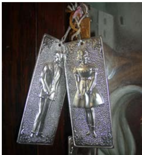
Fig. 2 : Crête Ex-votos contemporains en métal représentant de façon générique des personnes ayant formulé un voeu.