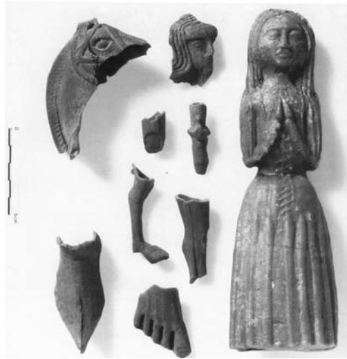
Fig. 3 : Ex-voto en cire, début du XVI e siècle. Exeter, Trésor de la cathédrale.