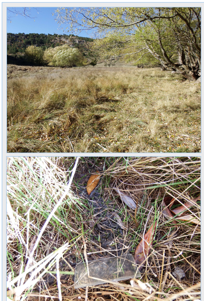
FIGURA 3. A: Hábitat típico de topillo de Cabrera en la sierra del Toro (Castelló); B: Excrementos y pasillos característicos de topillo de Cabrera.

Destaca el descubrimiento de la especie en la provincia de Castelló, donde no se había verificado su existencia desde el Neolítico. Entre otros yacimientos de Castelló donde se ha documentado su presencia, destaca el de la Cova Fosca, perteneciente al municipio de Ares del Maestrat, donde Sesé (2011) encontró restos óseos de topillo de Cabrera en diferentes niveles de edades comprendidas entre finales del Pleistoceno superior y la primera parte del Holoceno (entre 20.000-6.000 años antes del presente). Según diferentes trabajos, I. cabrerae fue una especie abundante en tierras valencianas durante miles de años hasta el inicio del Neolítico antiguo, cuando empezó a reducir su área de distribución, tal vez debido a los cambios producidos en el paisaje a partir del desarrollo de la economía de producción de alimentos (Guillem, P.M., 2010; 2011).