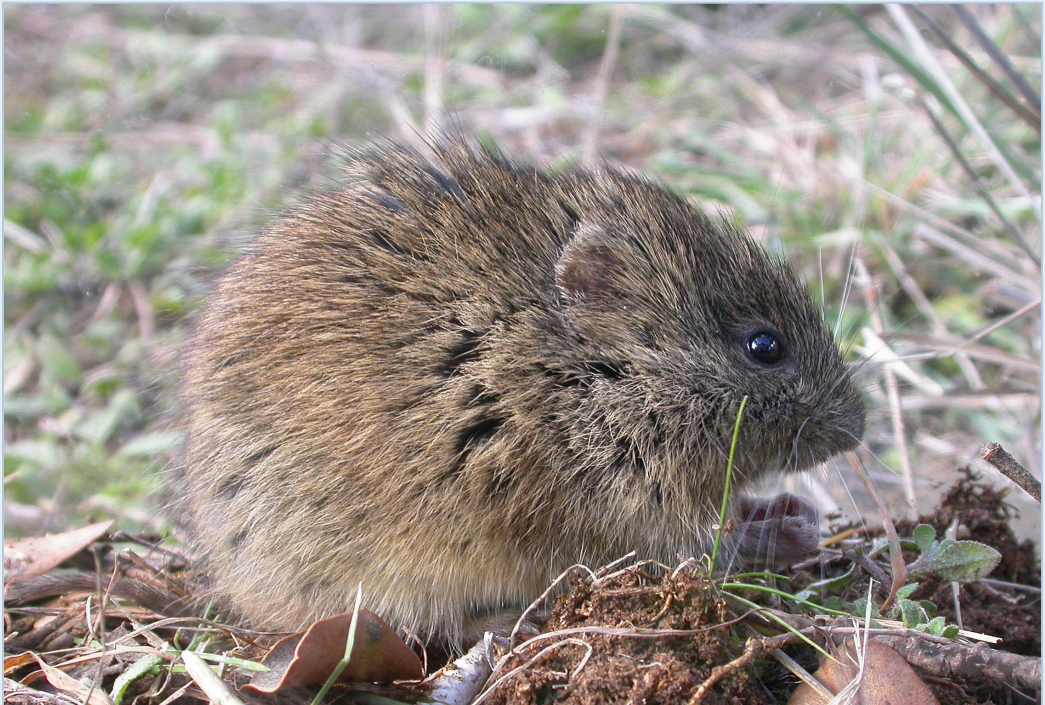
FIGURA 1. Iberomys cabreræ en Requena (València).

Durante el mes de noviembre de 2016 se llevó a cabo un sondeo de la especie en 8 cuadrículas UTM 10x10 de Castelló y en otras 6 de Alacant (Fig. 2), debido a su proximidad al área de distribución conocida del topillo de Cabrera y por disponer de hábitats potenciales.