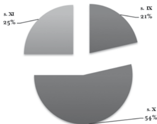
Figura 3. Científicos en Córdoba.