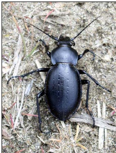
2. ábra. Magyar futrinka ( Carabus hungaricus ) az örkényi homokpusztán

A magyar futrinka tipikus sztyeppfaj, mely elsősorban homok- és löszpusztagyepekben, illetve a középhegységi és dombvidéki meleg lejtőkön, sziklagyepekben, lejtősztyepekben találja meg életfeltételeit (BÉRCES et al. in press, SZÉL 2006). A Kárpát-medencében homokpusztagyepekben fordul elő a Delibláttól (Szerbia), a Bánáton (Szerbia, valamint Románia), a Duna–Tisza közti homokhátságon, Tolna megye északi részén, a Kisalföldön át a Duna mentén egészen a Bécsi- és a Morva-medencéig (2. ábra).