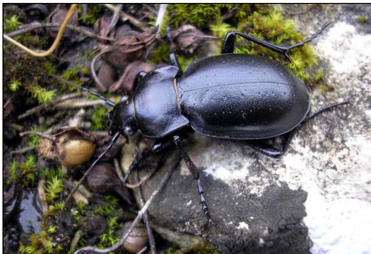
3. ábra. Magyar futrinka ( Carabus hungaricus ) dolomitsziklagyepben (Vilonya: Külső-hegy)

Amíg a Duna–Tisza közén meszes homokon képződött füves pusztákon, legelőkön, akácosok és fenyvesek szegélyében tartózkodik, addig a Nyírségben savanyú homokon kialakult hasonló növényzetben él. Ez utóbbi régióban azonban megfigyeléseink szerint többnyire a zárt növényzetű és a tavasszal olykor vízborította területeken honos, míg a Duna–Tisza közén kimondottan szárazságg kedvelőnek mutatkozik. Ez a jelenség feltehetően a meszes, illetve a savanyú homokon uralkodó talajtani és növényzeti viszonyok különbözőségével függ össze. A Nyírségben, Újfehértón felhagyott almásban (KUTASI et. al. 2004), Nyíradonyban parlagfüves élőhelyen, Nyírgelsén pedig a művelésből évek óta kivont napraforgó- illetve gabonatóbla területén is megfigyeltük (KÖDÖBÖCZ 2005). A homokhoz képest jóval kevesebb alkalommal észlelték löszös alapkőzetű helyeken való megtelepedését, mint például a Hajóshoz tartozó Érsekhalmán, a Tolna megyei lelőhelyek egy részében (Simontornya) valamint a Duna mentén Komárom-Esztergom megye térségében. Ezekben a helyeken feltehetőleg részben a löszön képződött talaj lazább szerkezete, részben homokkal való keveredése teszi az élőhelyet alkalmassá a magyar futrinka számára.