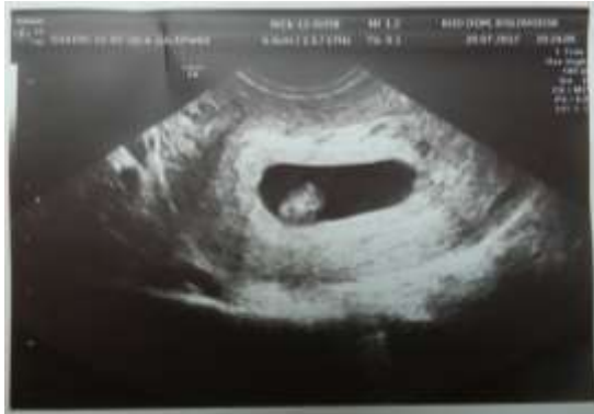
Рисунок 2 б – Вагітність 10 тижнів. Передлежання хоріона

відно) та була відсутня в групі контролю ( p < 0,05 ). Ознакою загрози переривання вагітності є співвідношення довжини шийки матки до її діаметру 1,16 \pm 0,04 (норма 1,53 \pm 0,03 ), а також зміна анатомії внутрішнього зіву з «Т» форми в «U» форму у випадку пролабування плідного міхура (рис. 3).