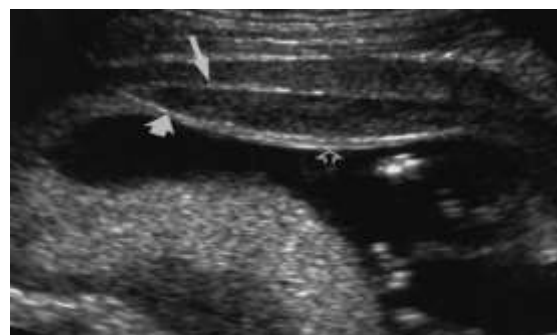
Рисунок 2 а – Ретрохоріальна гематома

Одним із патогенетичних факторів передчасної пологової діяльності є інфекційний процес, який може мати внутрішньоматкову локалізацію та бути наслідком перелічених вище ускладнень гестаційного процесу.