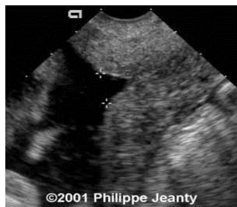
Рисунок 3 – Т-подібна та U-подібна форми маткового зіву у випадку пролабування плідного міхура

Аналіз стану новонароджених залежно від типу плацентації свідчить, що при монохоріальній вагітності стан дітей при народженні оцінювався нижче ніж 7 балів за шкалою Апгар у п'ять разів частіше. Це переважно відмічалось за рахунок фізіологічної незрілості, гіпотрофії, асфіксії різного ступеня. Слід враховувати і