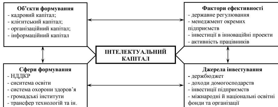
Рис. 1. Схема формування, нагромадження, використання й відтворення ІК [авторська розробка]

Концептуальна схема процесу формування, нагромадження, використання й відтворення інтелектуального капіталу наведена на рис. 1.