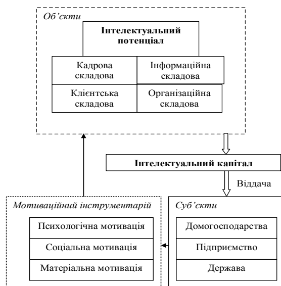
Рис. 2. Концептуальна схема формування та відтворення ІК [авторська розробка]

Загальну схему формування та відтворення інтелектуального капіталу показано на рис. 2.