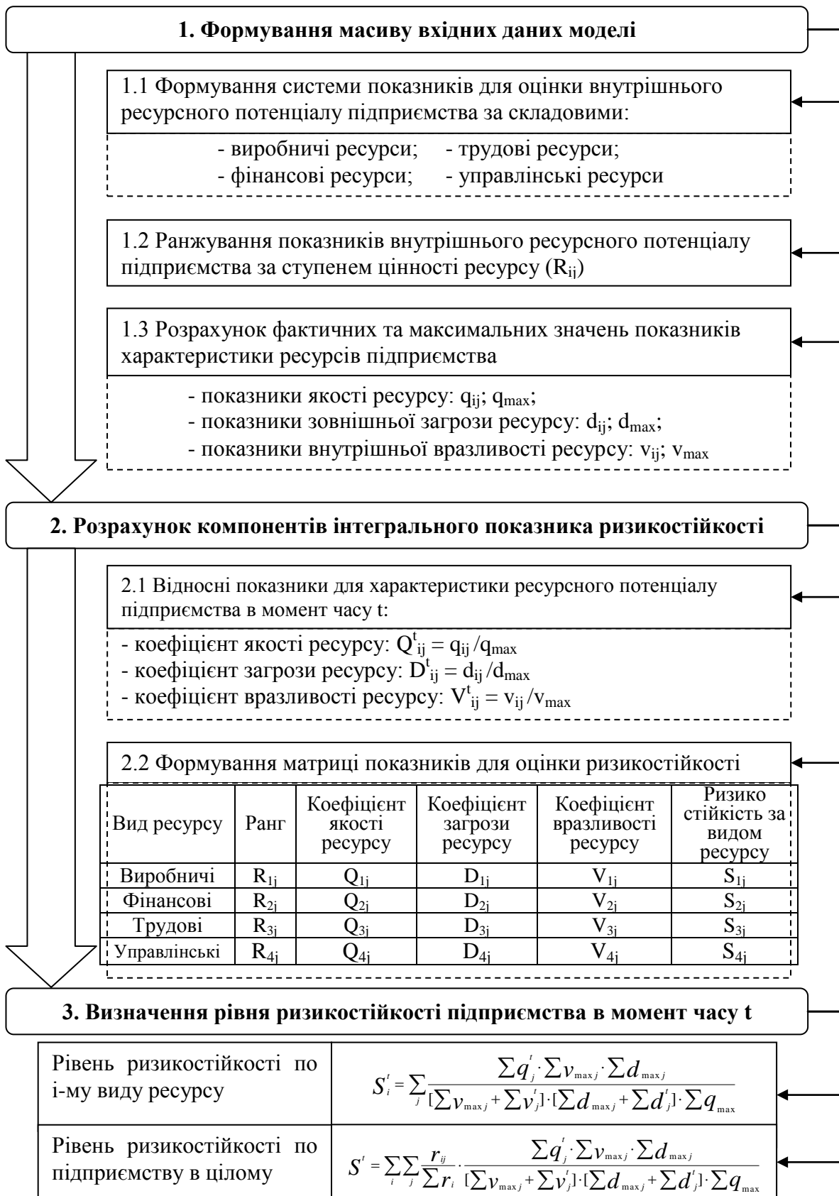
Рисунок 2 - Модель діагностики ризикостійкості підприємства при управлінні інноваційною діяльністю (авторська розробка)