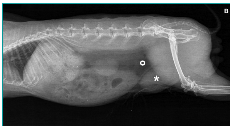
Figura 1 - (A) Superficie ventrale addominale di un coniglio maschio intero. Si noti la tumefazione a livello dei cavi inguinali. Tale tumefazione aveva consistenza elastica alla palpazione e la sua compressione determinava la fuoriuscita di urine. (B) Esame RX diretto (proiezione LL). All'esame diretto, l'area di proiezione dell'opacità vescicale appare occupata solo da grasso (o) mentre, caudo-ventralmente al profilo della parete addominale, è visibile un'opacità ovoidale a densità omogenea di tipo liquido (*).