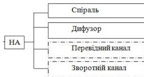
Рисунок 3 – Блок-схема до системного аналізу НА

Другим етапом була виконана так звана «м'яка» параметризація, що дозволило скласти рівняння залежностей всіх геометричних розмірів кожного блоку НА, що можуть змінюватись залежно від робочих параметрів насоса в межах заданих приєднувальних та габаритних розмірів. Сформована система нелінійних рівнянь, які описують систему зв'язків, що управляє формою блоків НА.