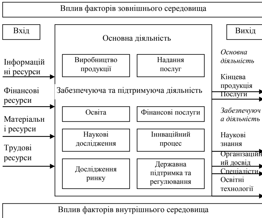
Рисунок 2 – Структурна модель розвитку регіону