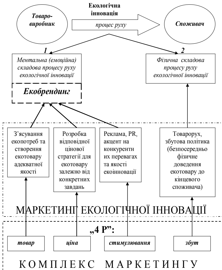
Рис. 3 Роль та місце маркетингу інновацій в екобрендингу

Говорячи про роль та місце маркетингу інновацій в екологічному брендингу, прокоментуємо поданий на рис. 3 взаємозв'язок.