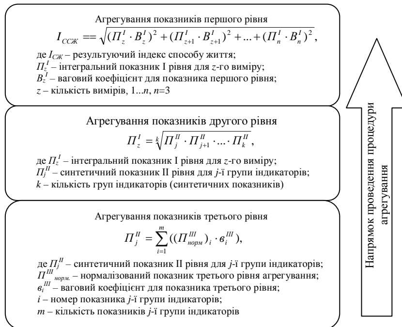
Рис. 1. Етапи агрегування показників сталого способу життя

Процедуру агрегування показників сталого способу життя пропонується проводити за наступними етапами, попередньо нормалізувавши їх значення за стандартною методикою (рис. 1).