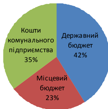
Рисунок – Структура витрат на реалізацію Програми забезпечення населення м. Суми якісною питною водою в достатній кількості на 2006-2020 роки за джерелами фінансування коштів.

Необхідно відмітити, що у загальних видатках на реалізацію запланованих заходів лише 23,5 % складають кошти місцевого бюджету - 40565 тис.грн (рис.). До того ж понад 40% ресурсів повинні бути асигновані на першому етапі впровадження Програми, при чому за перші три роки (2006-2008) обсяг коштів повинен був скласти 10260 тис грн., тобто 25 % загального обсягу запланованих витрат на проведення заходів щодо забезпечення мешканців міста Суми якісною питною водою в достатній кількості. Нажаль, аналіз кошторисів видатків використання фонду охорони навколишнього природного середовища міста Суми за зазначений період показав відсутність серед запланованих напрямків витрачання коштів програм та заходів, які мають на меті виконання зазначеної програми.