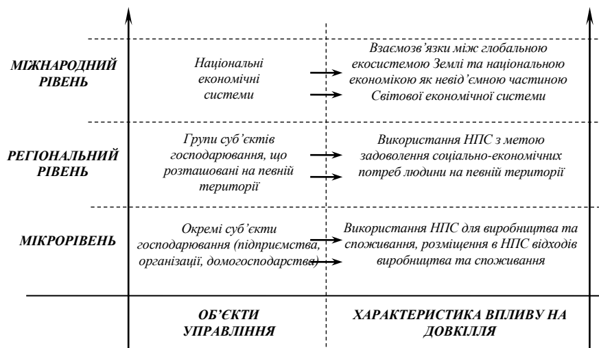
Рисунок 1 – Рівні еколого-економічних взаємозв'язків у системі управління економічним потенціалом регіону

Концепція управління ЕПР з УВЕБ повинна пов'язувати в єдине ціле три основні регіональні підсистеми (інституціональну, соціально-економічну та екологічну) і розкривати основні принципи їх взаємодії (рис. 1).