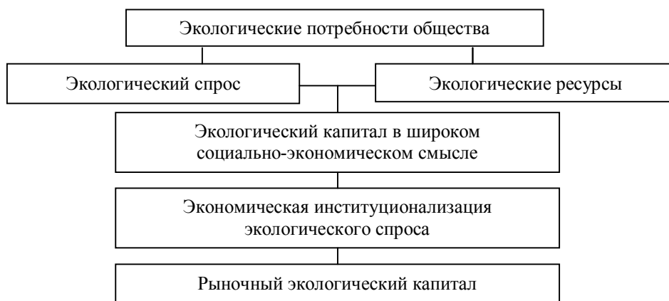
Рис. 1. Экономическое содержание экологического капитала

Схематично экономическое содержание экологического капитала представлено на рис. 1.