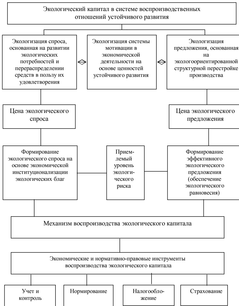
Рис. 3. Система воспроизводства экологического капитала

Ставка процента определяет стоимость экологического капитала в процессе капитализации ежегодного эффекта от использования экологических ресурсов. В качестве последнего выступает экологическая рента , под которой понимается форма присвоения