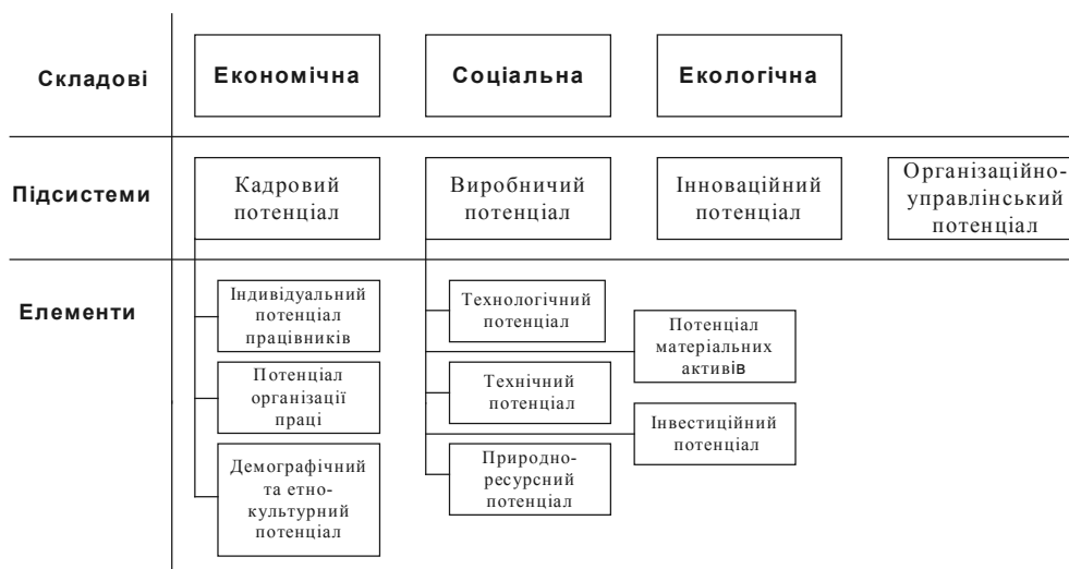
Рисунок 1 – Структура економічного потенціалу підприємства

У сукупності трудові, виробничі, інноваційні, організаційно-управлінські ресурси утворюють ресурсну структуру економічного потенціалу підприємства.