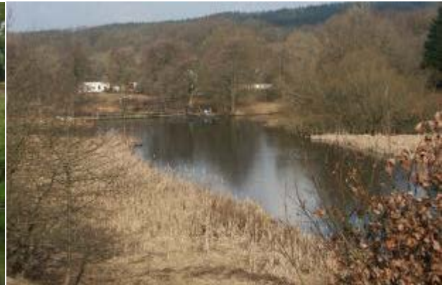
Opstemningen og møllesøen ved Vilholt Mølle 2002.