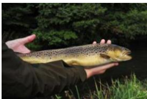
Fiskeundersøgelse på stryg nedstrøms Vilholt Mølle (Vilholtstryget ved Møldruphus).