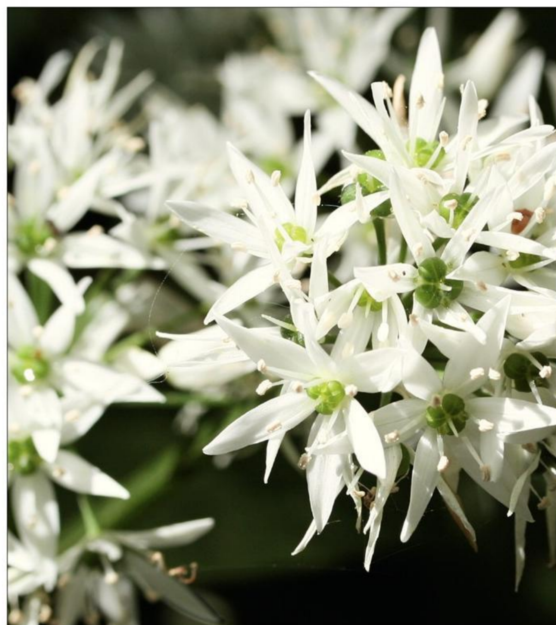
Blomstrende ramsløg ( Allium ursinum ).