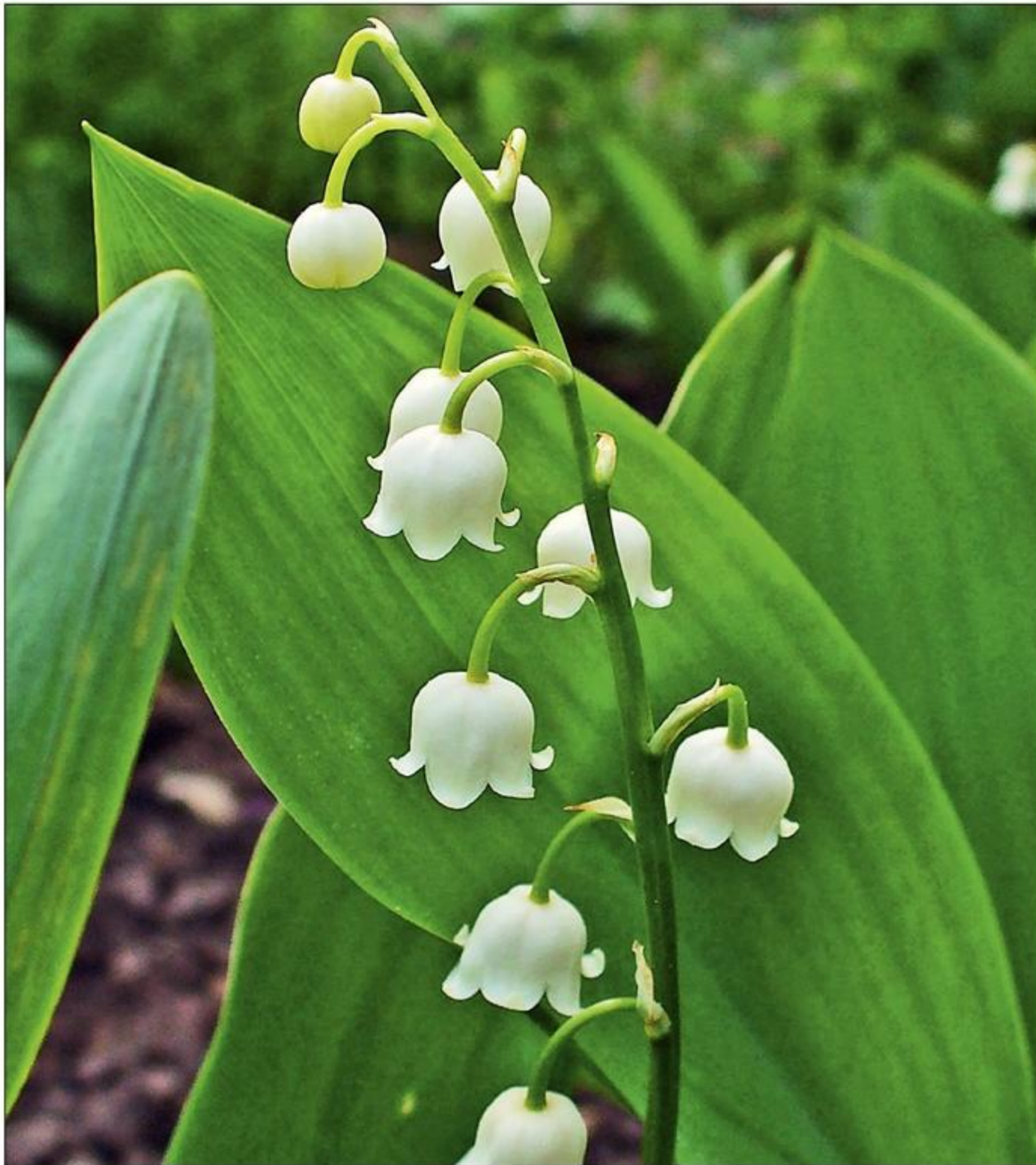
Blomstrende liljekonval ( Convallaria majalis ).

Ramsløg indeholder forskellige former for svovlholdige forbindelser, de såkaldte cysteinsulfoxider, som også findes i andre løgarter f.eks. hvidløg og forskellige flavonoider [2,3,4]. Umiddelbart indeholder ramsløg ingen alarmerende indholdsstoffer.