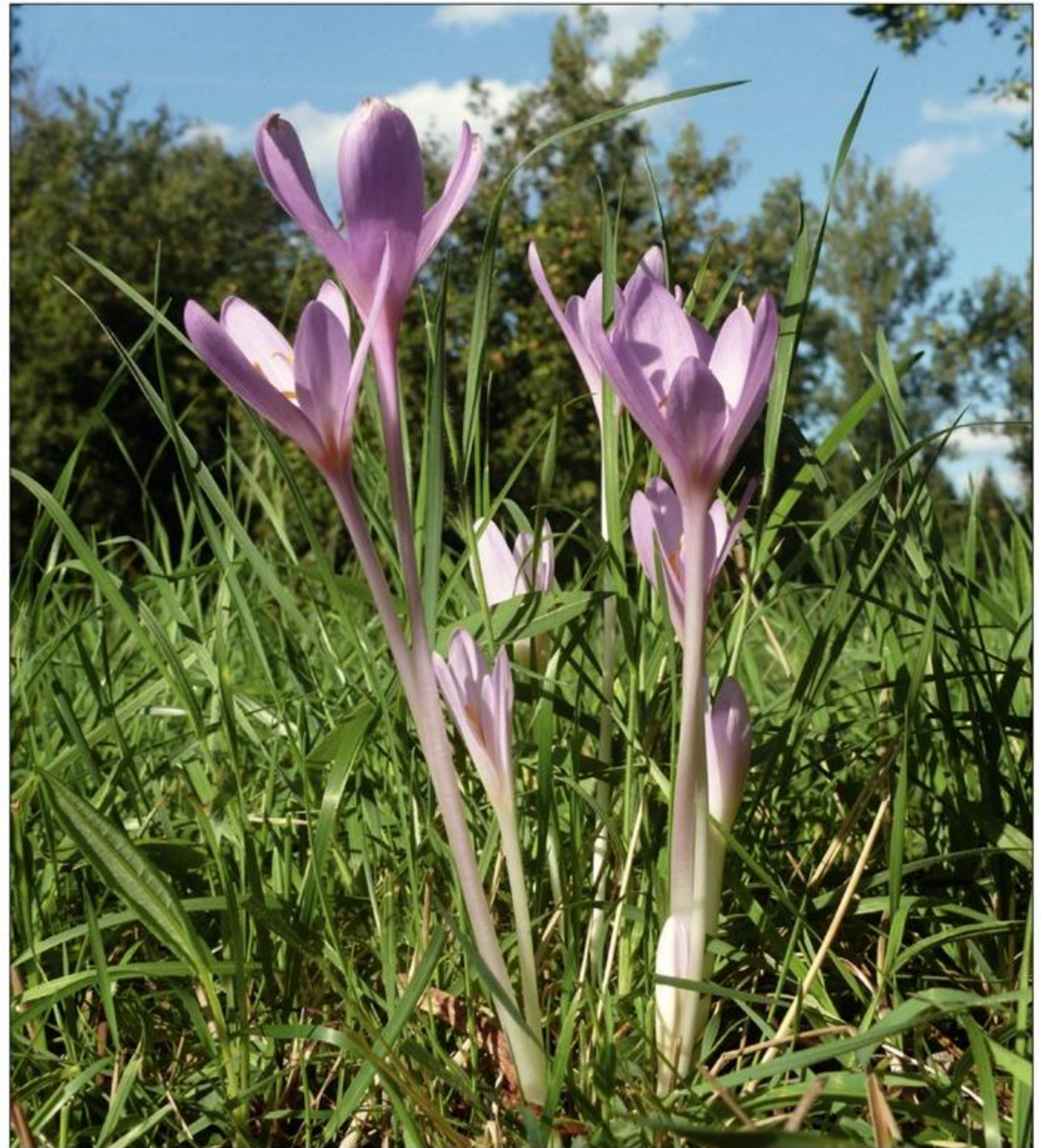
Blomstrende høsttidløs ( Colchicum autumnale ).

En tysk undersøgelse [5] har indsamlet oplysninger om 32