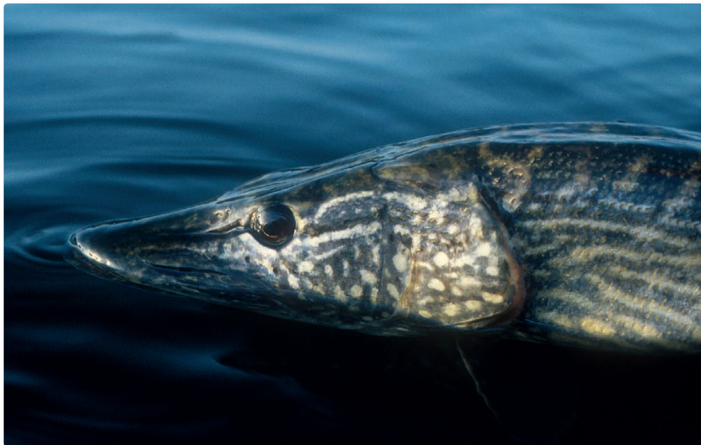
Fredningstiden kan med fordel udvides 14 dage i begge ender.

Sådanne lokale fænomener kan man imødegå ved at aftale lokale fredningstider. Ønsker man i den forbindelse maksimal sikkerhed for altid at dække den reelle gydeperiode er anbefalingen at indføre en generel fredning fra 15. marts til 15. maj. ☞