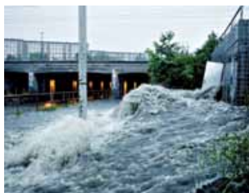
Forsidefoto: Skybrud over Lersø Parkallé i København 2. juli. Send fotos i 300 DPI til lr@danva.dk