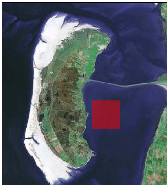
Figur 2. Området ved Skellod banke øst for Rømø, hvor undersøgelserne af effekten af fiskeri af stillehavsøsters planlægges gennemført. Inden for området markeret med rød farve vil de to undersøgelsesområder af 300×700 blive placeret. Positionerne på kortet er kun omtrentlige.