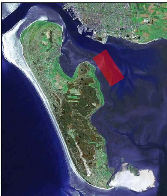
Figur 3. Området i Grådyb, syd for Esbjerg og øst for Fanø, hvor undersøgelserne af effekten af fiskeri af blåmuslinger planlægges gennemført. Inden for området markeret med rød farve vil de to undersøgelsesområder af 100×300 blive placeret. Positionerne på kortet er kun omtrentlige.

På figur 3 herunder kan placeringen af området til undersøgelse af blåmuslinger ses.