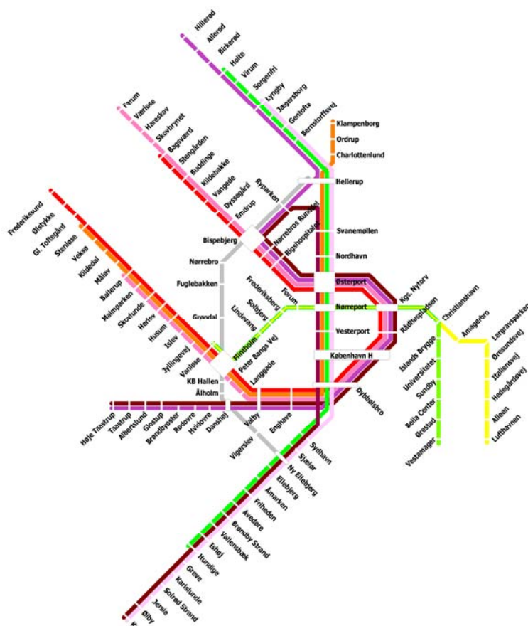
Figur 1: Linieføringskort for S-bane og metro med to nye S-banespor gennem København

For at vurdere den trafikale effekt af etablering af to nye S-banespor gennem København er der foretaget en køreplansbaseret rutevalgsberegning efter "Alt-eller-intet"-princippet. Rutevalgsberegningen foretager udelukkende en udlægning af passagerer på det kollektive trafiknet, og forudsætter derfor en kendt OD-matrice. For derfor at kunne vurdere trafikvæksten er det nødvendigt at foretage en opskrivning af OD-matricen på baggrund af forskelle i generaliserede tidsovkostninger fra sammenlignelige rutevalgsmodelkørsler 1 . Ændringerne i den kollektive trafik for morgenmyldretiden er visualiseret i figur 2.